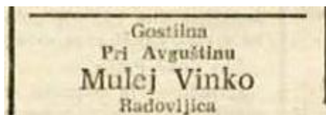
Glas, 29. 12. 1967