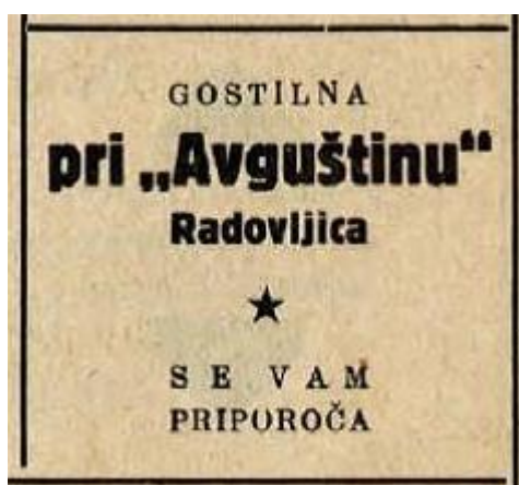
Gorenjski glas, 27. 4. 1952