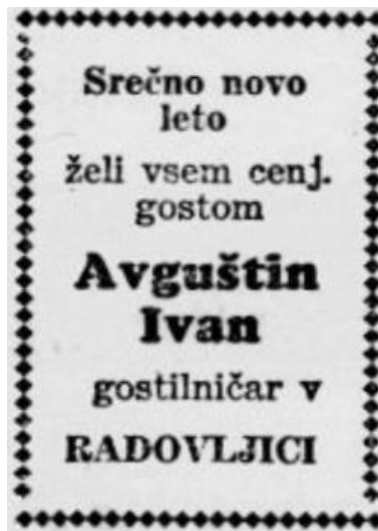
Voščilo gostilne Avguštín Vir: Gorenjec, 1. 1. 1932