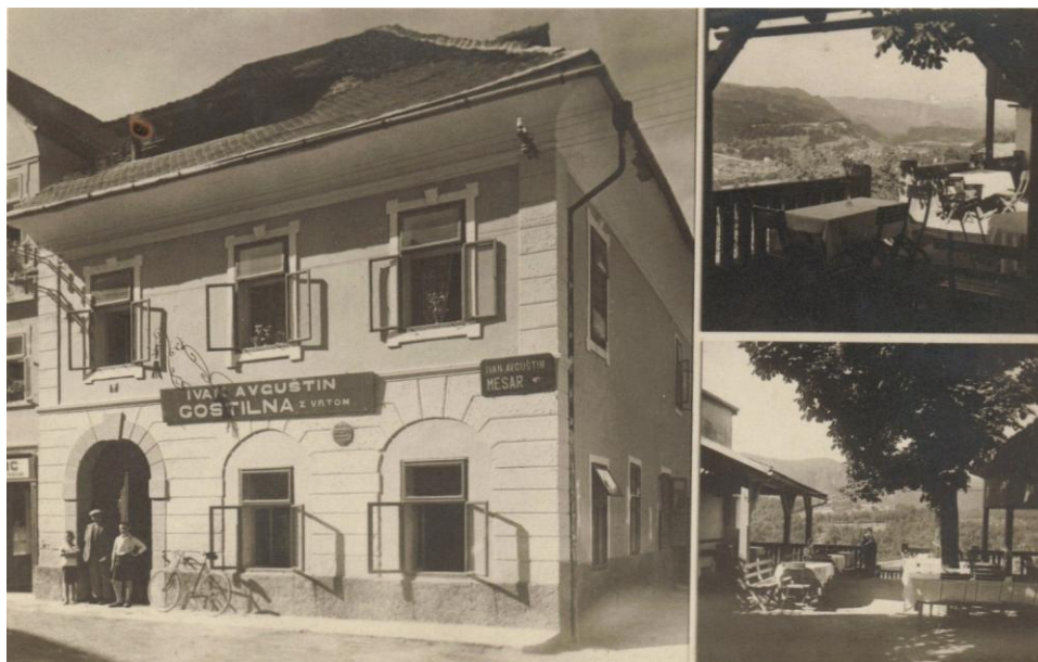
Razglednica gostilne Avguština, pred 1930