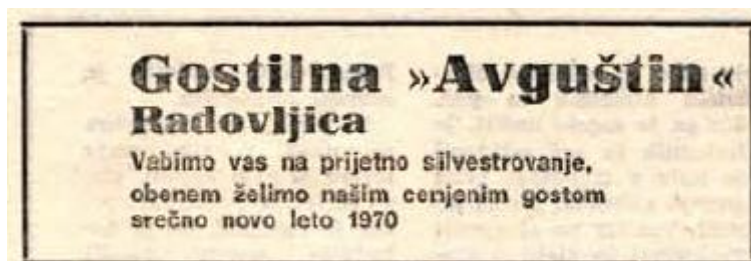
Glas, 17. 12. 1969