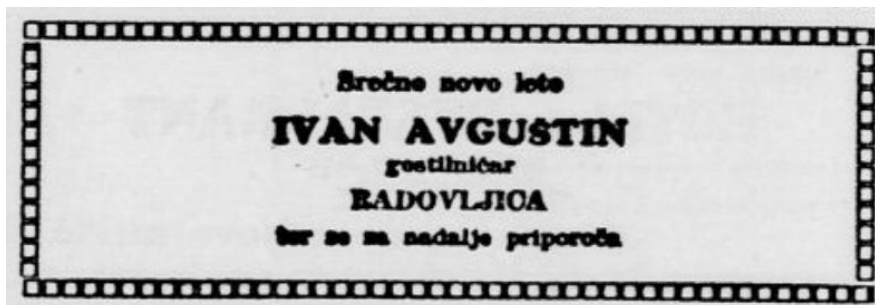
Voščilo gostilne Avguštín