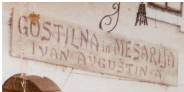
Tabla gostilne in mesarije Avguštin-a

Veselica gasilnega društva , dne 4. t. m. je izpala nad vse pričakovanje. Toliko gostov že dolgo nismo videli na predpustni zabavi v Radovljici. Vsi prostori Avguštinove gostilne so bili natlačeno polni, v I. nadstropju je igral znani »šramel kvartet« v občo pohvalo in vztrajno do jutra, spodaj so se pa vrtili neumorno mladi pari ob zvokih harmonike. Bila je prava ljudska veselica, ki se gotovo ponaša z lepim materialnem uspehom.