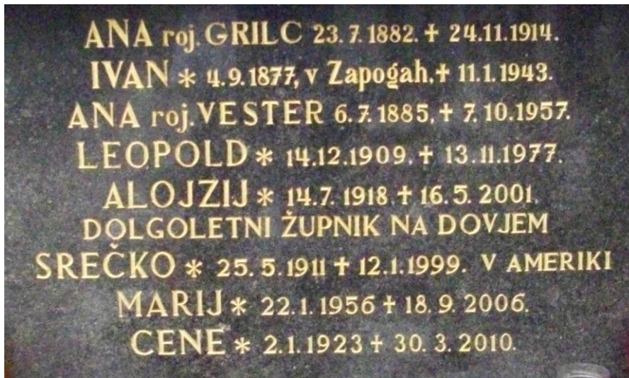
Nagrobnik – Avguštin Vir: foto DAR