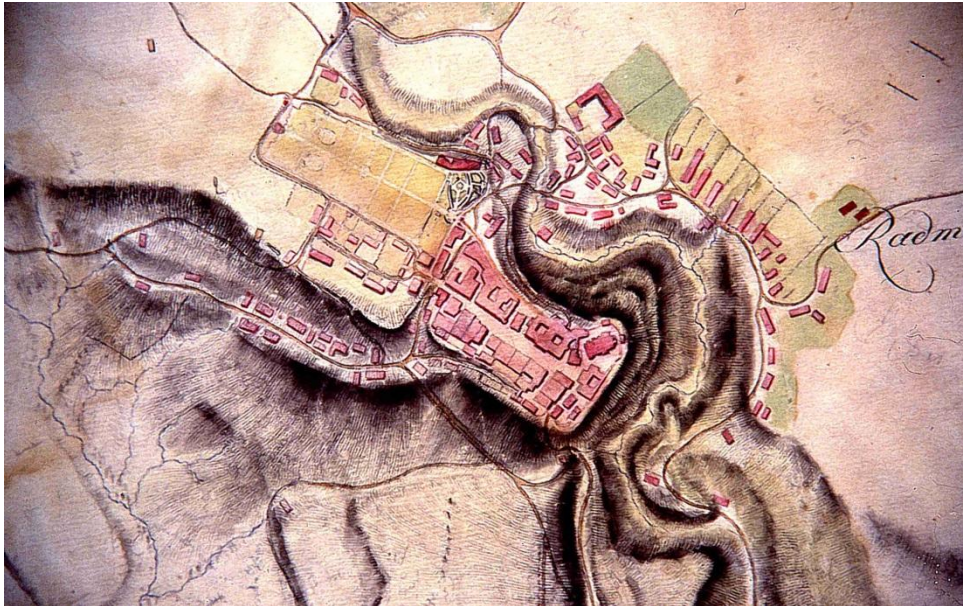
Radovljica na karti regulacije reke Save, 1807