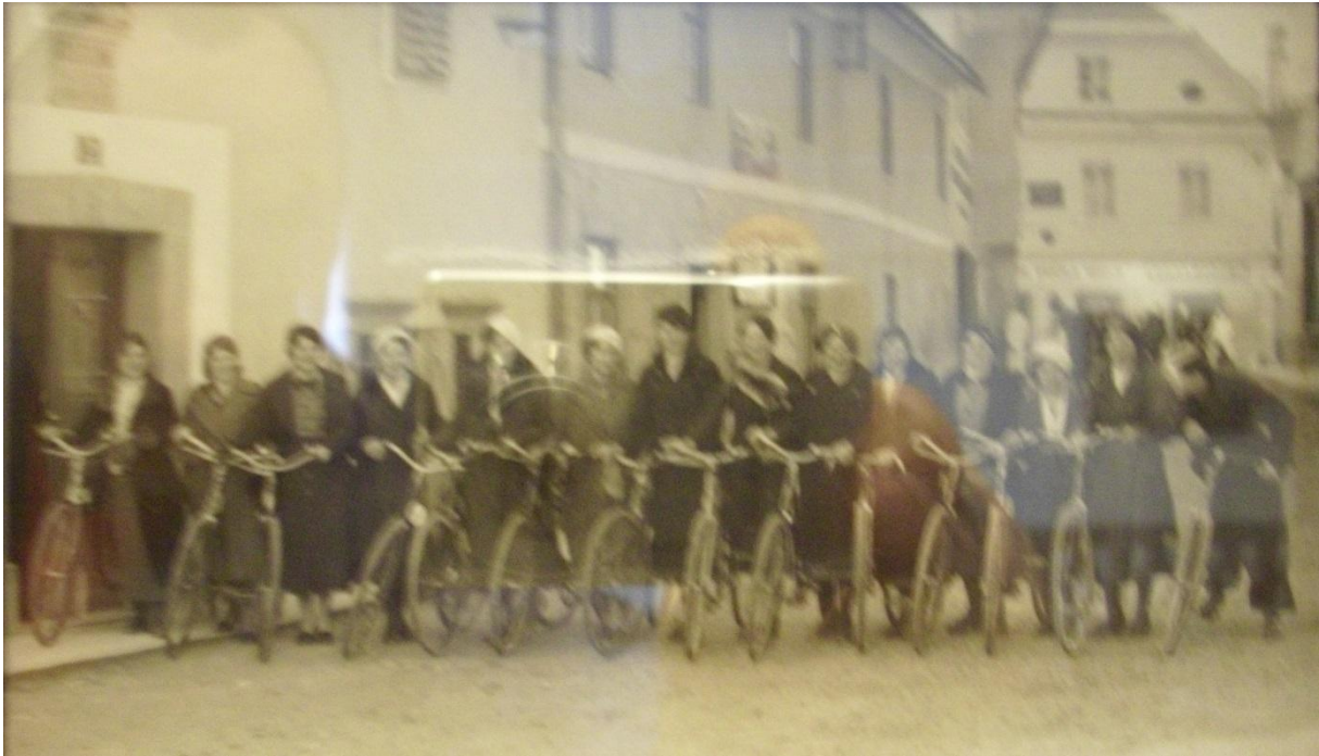
Kolesarke pred gostilno Žan Vir: foto DAR (razstava Leopold Kolman)

Vir: Družabno življenje v Radovljici v obdobju med obema vojnama (avtorica Alenka Klemenc / Diplomaska naloga, 1985).