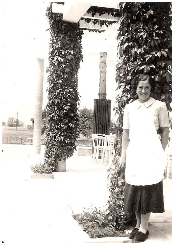
Bife na kopališču Obla Gorica, pred 1940

Gostilne v Radmannsdorfu. Pred leti so Radmannsdorf, potem ko je mestna uprava zgradila s sredstvi mestne hranilnice plavalni bazen in hotel, povzdignili v letovišče.