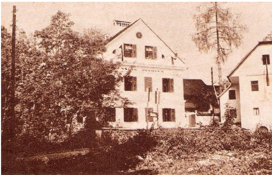
Penzion Jelovica v Kamni Gorici