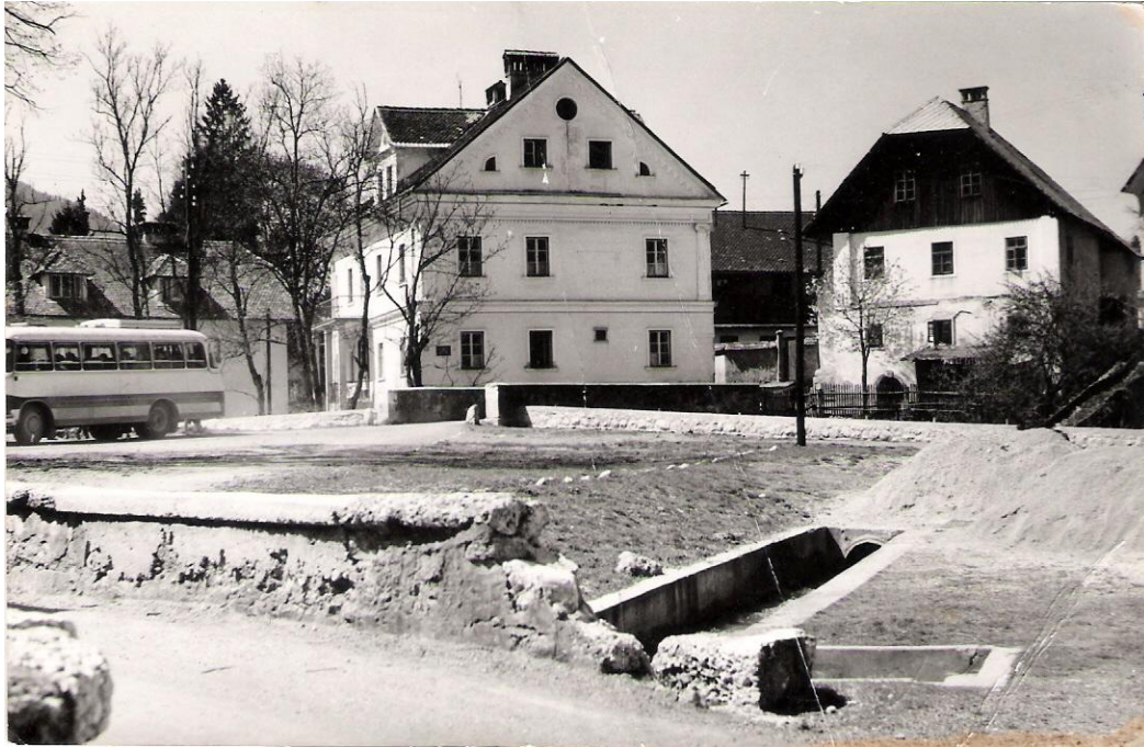
Stavba bivšega Penziona Jelovica, od. 1966