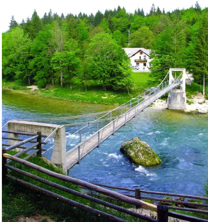
Nova Fuxova brv

Prišli so novi časi in nova moderna Fuxova brv ... Prav ob njej je zrasel vodni turistični center za katerega skrbi Tinaraft.