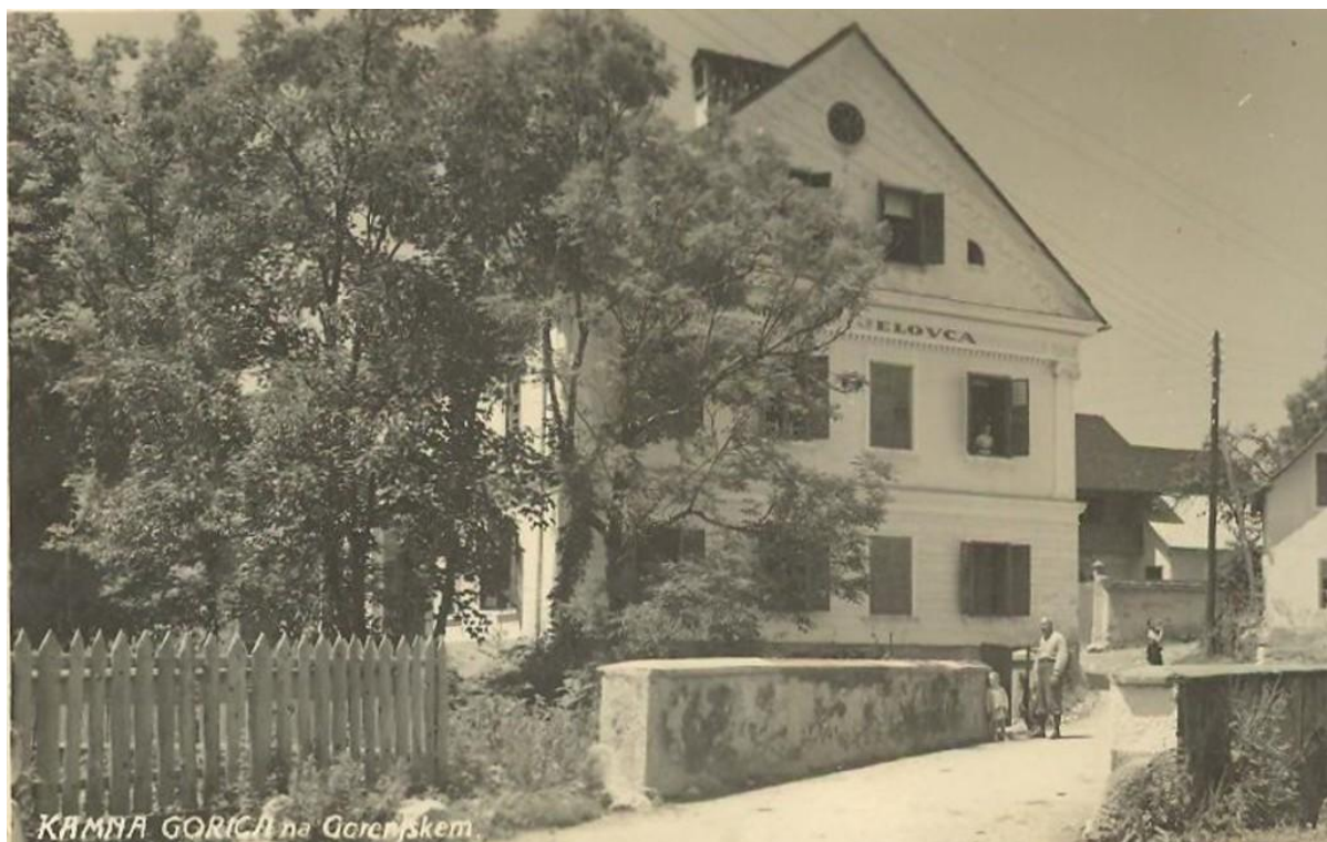
Penzion Jelovica, od. 1943