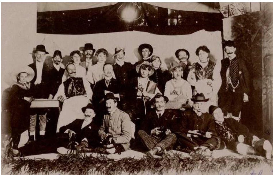
Igra »Deseti brat« - dvorana gostilne Kunstelj, 1906