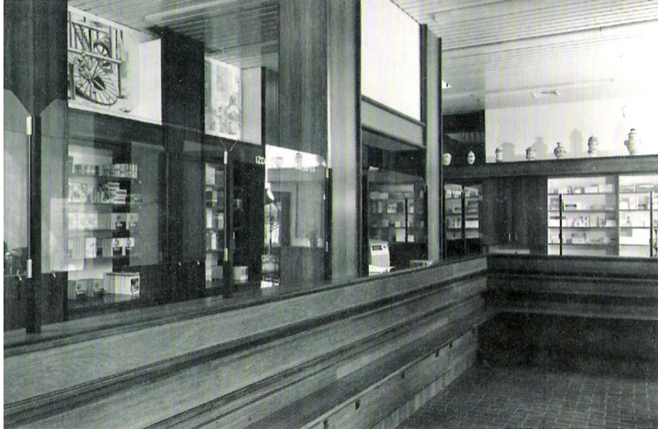
Lekarna Radovljica - oficina, 1977-97