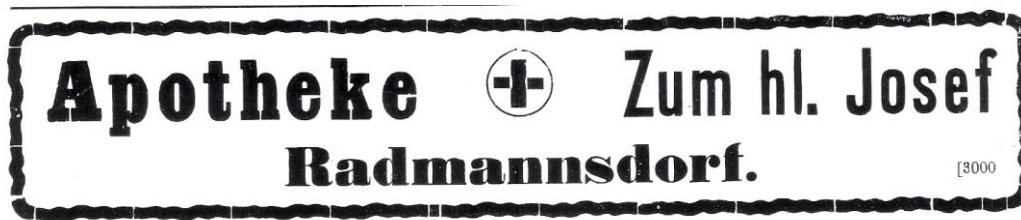
Oglas »Lekarne pri sv. Jožefu«, 1908 Vir: Illustrierte »Reise und Bäder Zeitung« (24. 06. 1908)