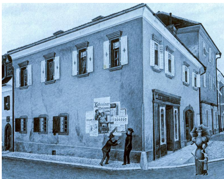
Lekarna - Apotheke, 1899