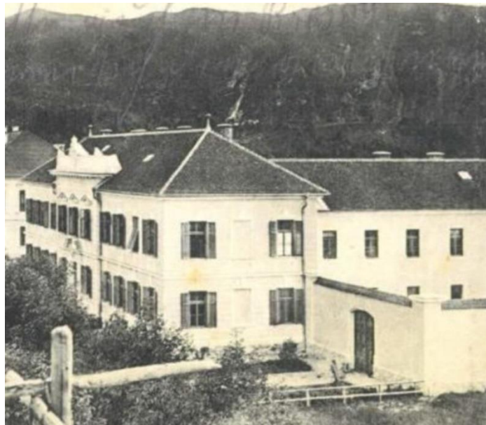
Sodišče in zapori v Radovljici, 1914-17