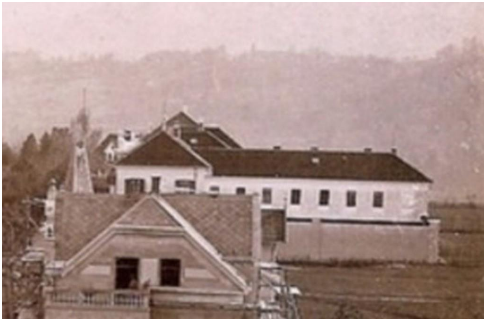
Novo radovljiško sodišče – in zapori, ok. 1905