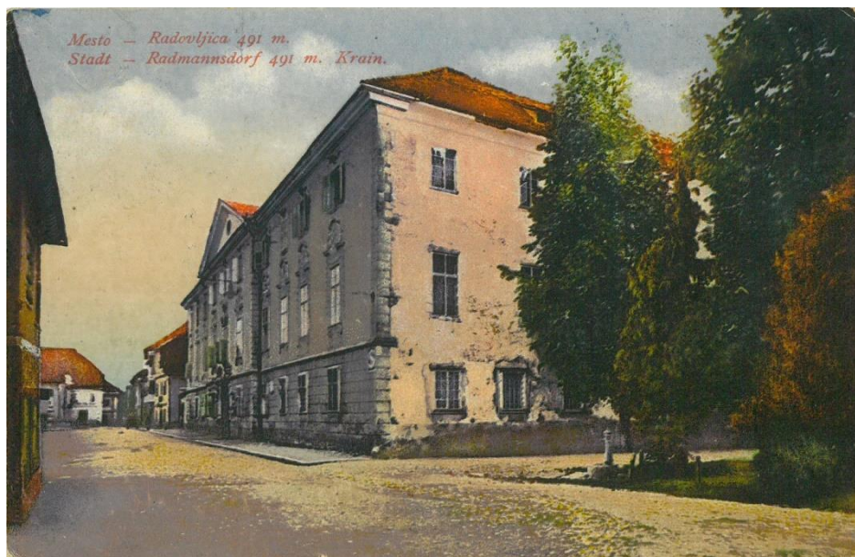
Graščina, ok. 1915