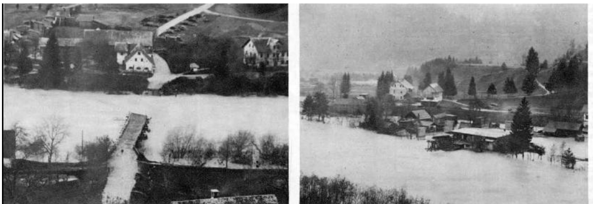
Novo povodnji v Sloveniji. Letošnje leto zadevajo Slovenijo udarci drug za drugim.

Komaj smo se nekoliko oddahnili od strahot septembrskih povodnji, že smo doživeli v noči od 29. na 30. okt. nove vodne katastrofe, ki so prizadele zlasti vso Gorenjsko in nekatere dele Štajerske. Naša leva slika nam kaže raztrgan »Pižov most« čez Savo pri Radovljici, desna slika pa poplavljen tovarno g. I. Dernača na Lancovem pri Radovljici.