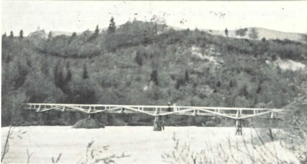
Predtrška brv, ok. 1900.

Vir: Gorenjski muzej Kranj (razglednica, odposlana 1903)