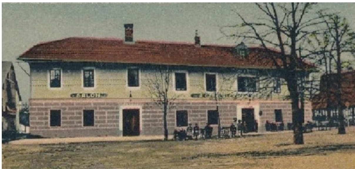
Gostilna Gabrijelčič, od. 1910