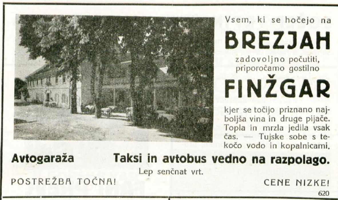
Oglas gostilne Finžgar, 1931