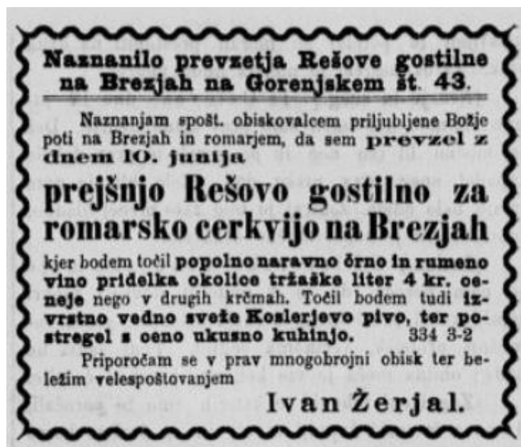
Slovenec, 13. 06. 1894