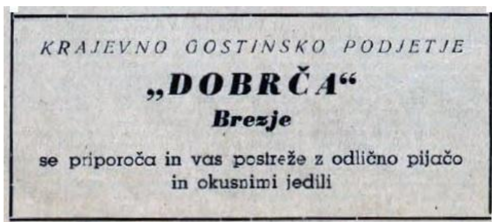
Gorenjski glas, 27. 4. 1952