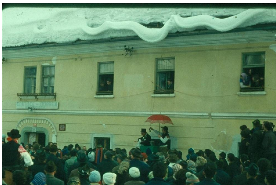
Gostilna Dobrča, po 1945