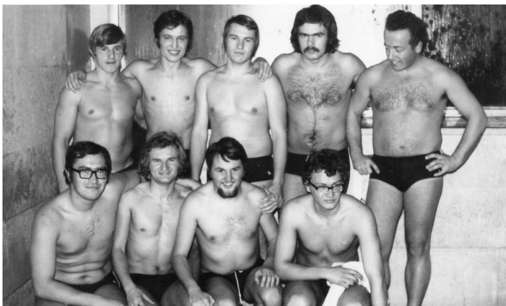
Vaterpolisti PK Radovljica, ok. 1971