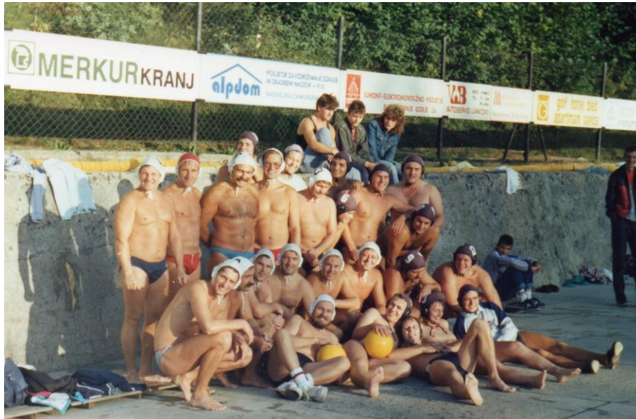
Vaterpolisti, ok. 1980