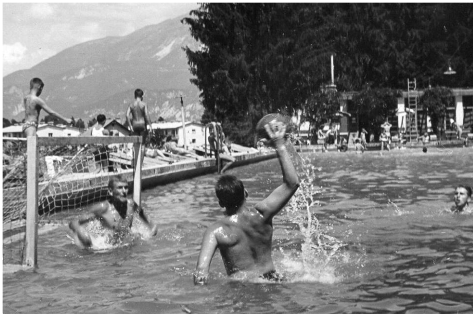
Boj strelca in vratarja, ok. 1970