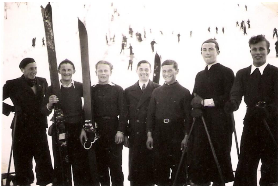
Radovliški smučarji (verjetno v Krpinu), pred 1940