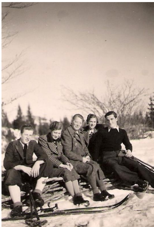
Smučarji na Taležu, ok. 1940