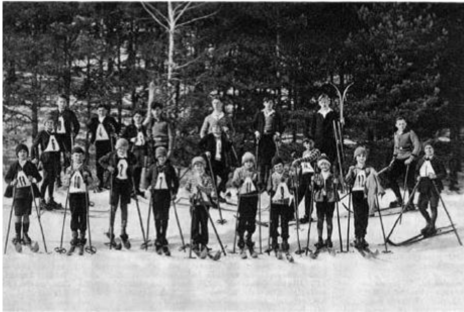
Tekma naraščajnikov Smučarskega kluba Radovljica, 1929