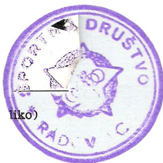
Žig Športnega društva Radovljica

Rokomet v Kropi. Na partizanskem prvenstvu Gorenjske v rokometu so Tržičani zasedli 3. mesto izza Stražišča in Kranja. Edino zmago so zabeležili proti zadnje plasirani Kropi. Prireditev je bila zanimiva, srečanja pa razburljiva in napeta. Vir: Tržiški vestnik, 29. 11. 1958