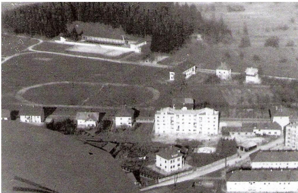
Rokometno-košarkarsko igrišče, ok. 1960