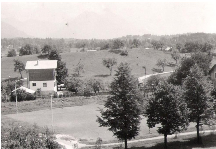
Rokometno igrišče - objekt ŠD Radovljica, 1966

RK Radovljica organizira MP Gorenjske (1966). Rezultati domače ekipe: Radovljica : Krvavec 18:7, Jesenice : Radovljica 2:11, Radovljica : Kranjska Gora 5:9, Radovljica : Tržič 5:5.