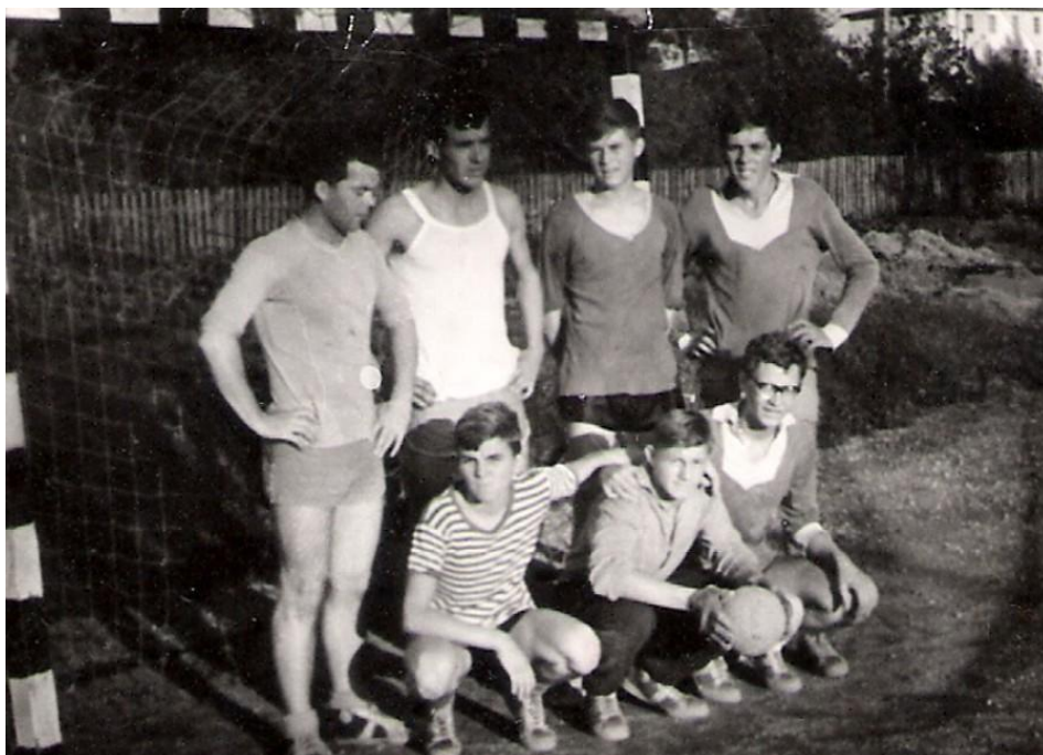
Ekipa RK Radovljica, 1963