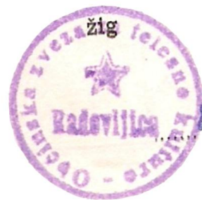
Žig OZTK Radovljica