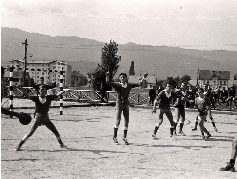
Igrišče ob bazenu, 1959/60

Rokomet v Kropi. Na partizanskem prvenstvu Gorenjske v rokometu so Tržičani zasedli 3. mesto izza Stražišča in Kranja. Edino zmago so zabeležili proti zadnje plasirani Kropi. Prireditev je bila zanimiva, srečanja pa razburljiva in napeta. Vir: Tržiški vestnik, 29. 11. 1958