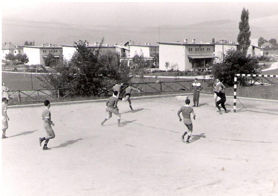
Igrišče ob bazenu, 1959/60