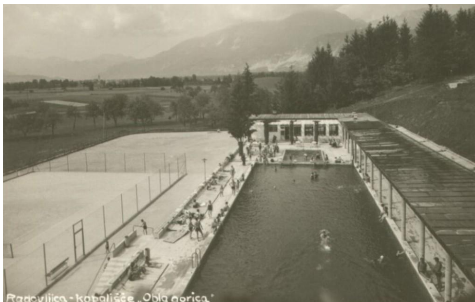
Kopališče »Obla Gorica« s tenis igriščem, ok. 1935