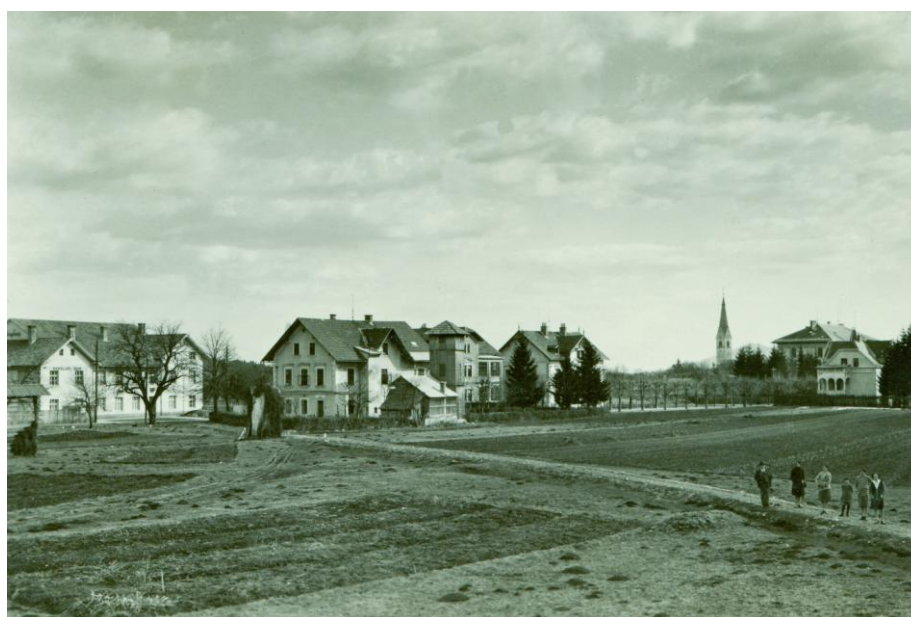
Sokolski in gasilski dom, ok. 1925

Natančni podatki o sami gradnji sokolskega doma so natančno opisani v Sokolski spomenici. Zato o tem le na kratko.