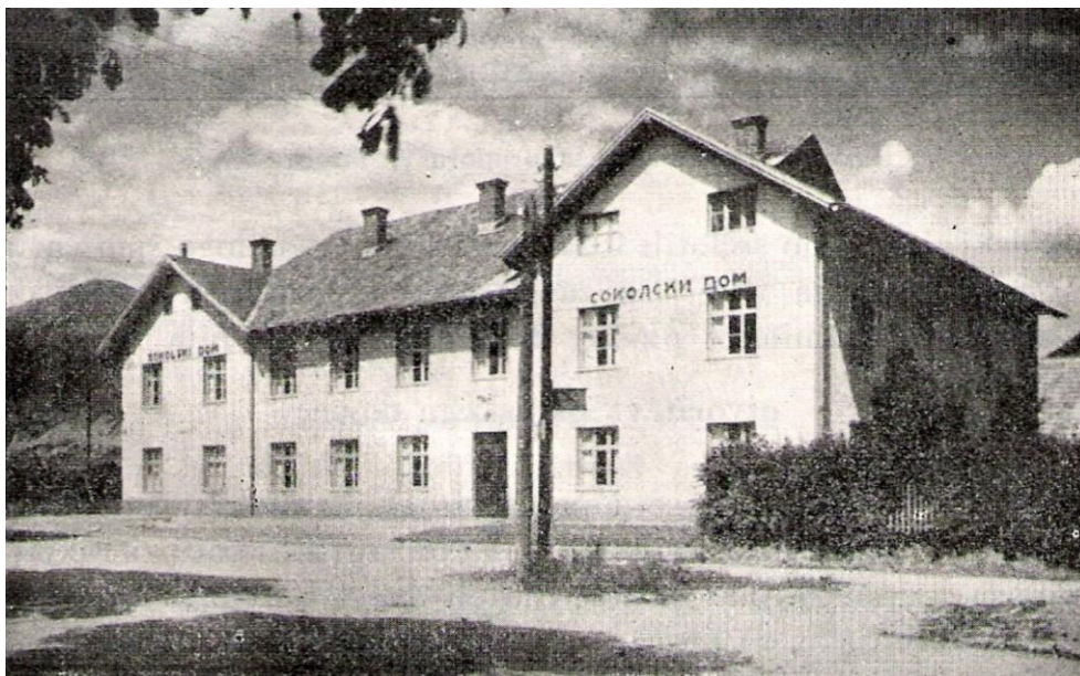
Sokolski dom, 1922