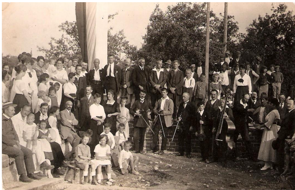
Začetek gradnje Sokolskega doma, 1921