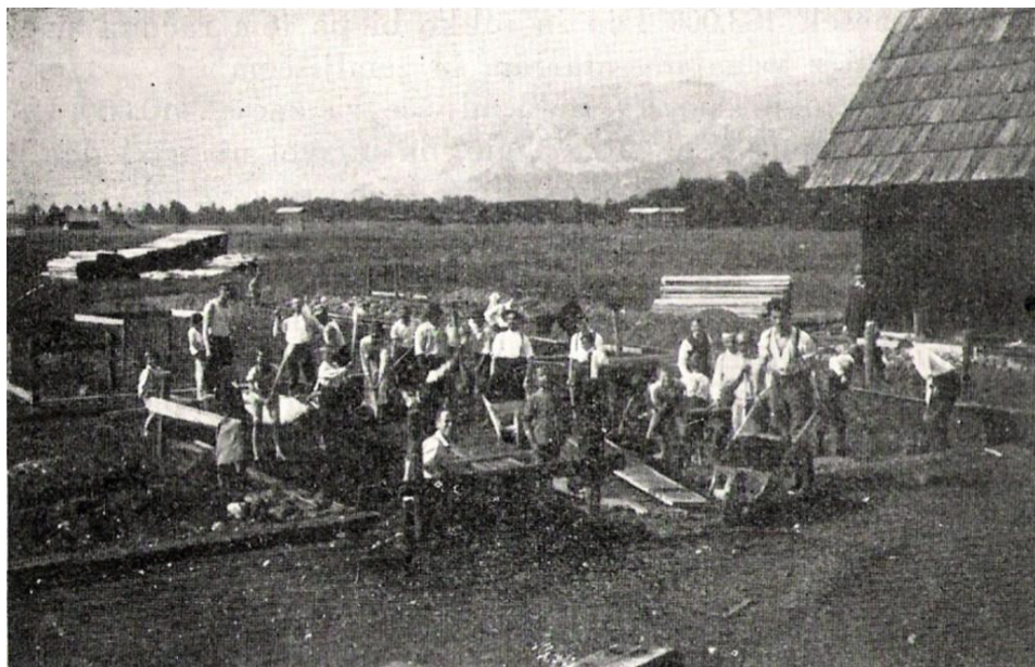
Kopanje temelja Sokolskega doma, 1921