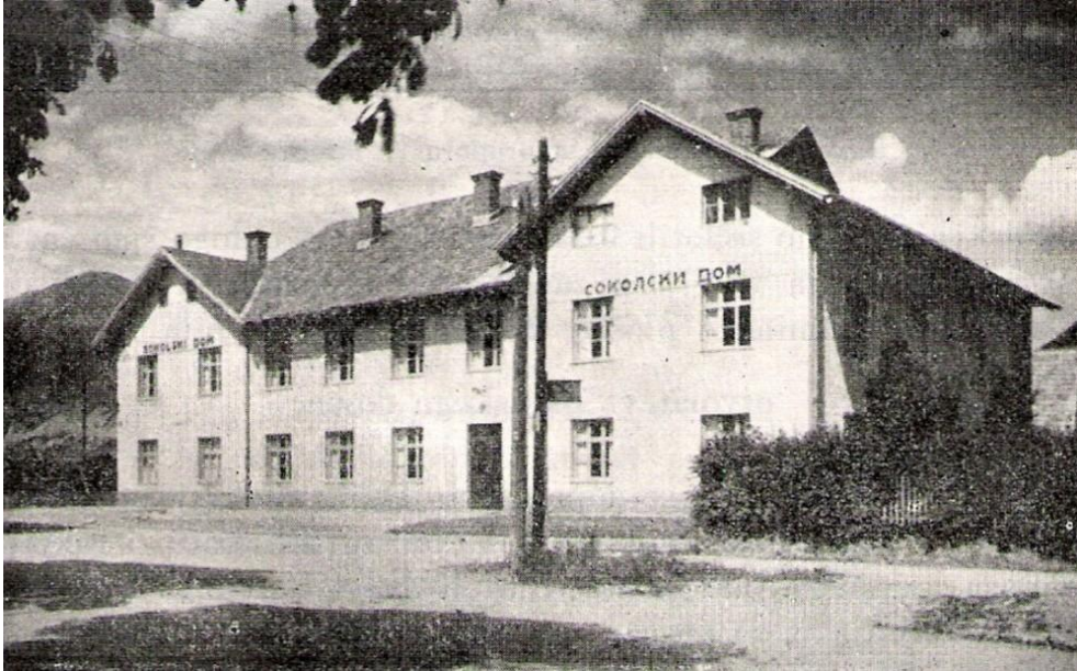
Sokolski dom - prvo znano avtobusno postajališče, ok. 1930

Cesta v letih 1933-1953. Ob gradnji hotela Grajski dvor so tudi spremenili traso ceste. Ta je še vedno šla skozi Predtrg, le da tokrat ni šla mimo Marolta, ampak so zgradili novo traso mimo hotela Grajski dvor , kjer so po letu 1934 ustavljali tudi avtobusi .