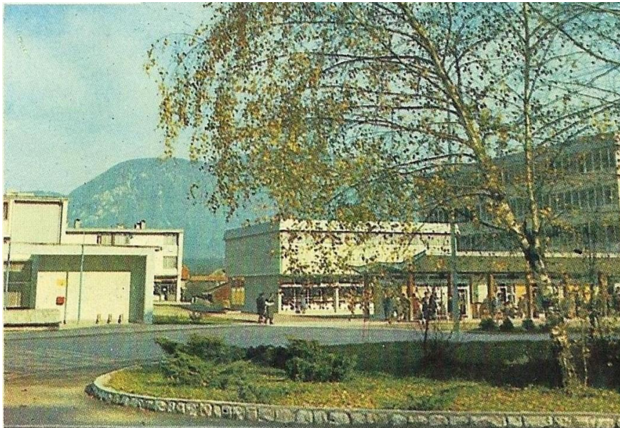
Avtobusna postaja v Radovljici, ok. 1965 Vir: Digitalni arhiv Radovljica (razglednica od. 1965)