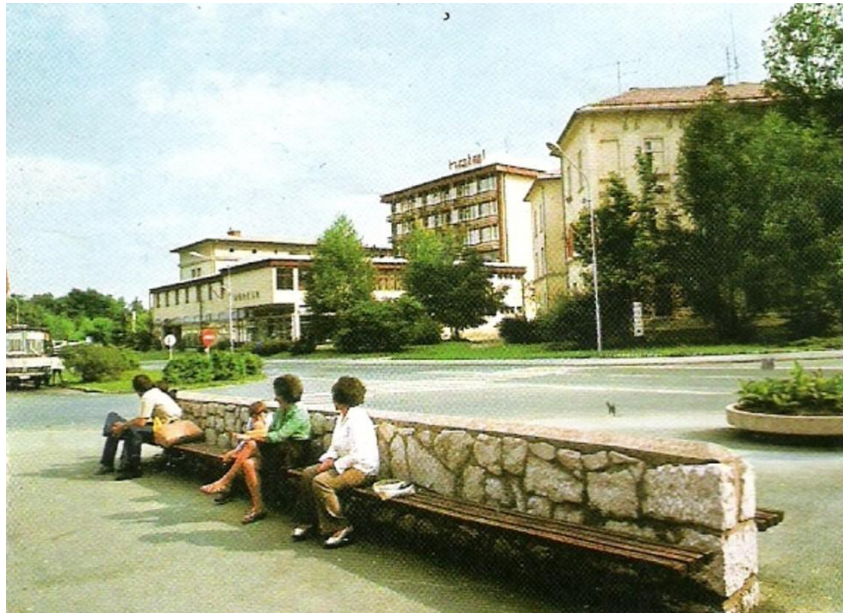
Znamenita kloпка pred pošto - neuradni podaljšek AP, 1984