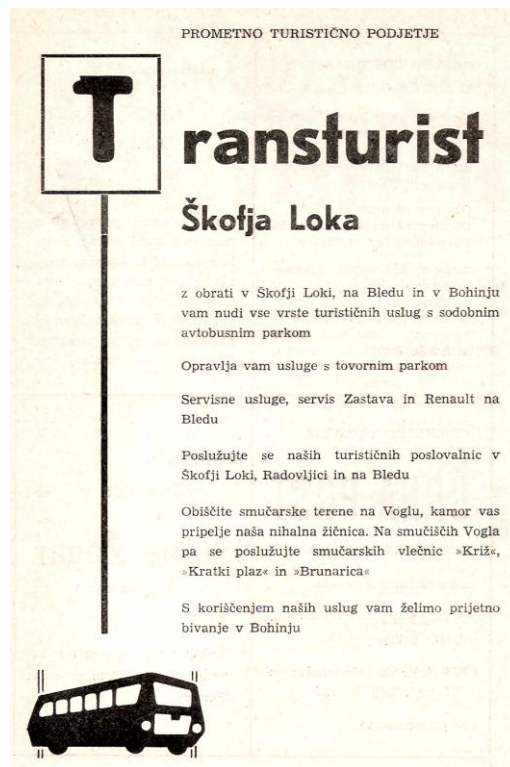
Oglas PTP Transturist - turistična poslovalnica Radovljica, 1966