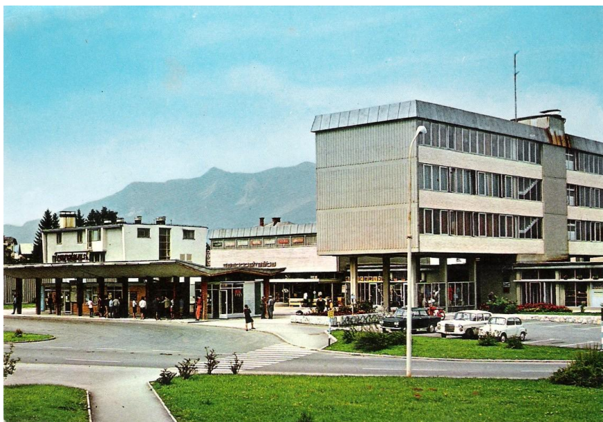
Avtobusna postaja v Radovljici