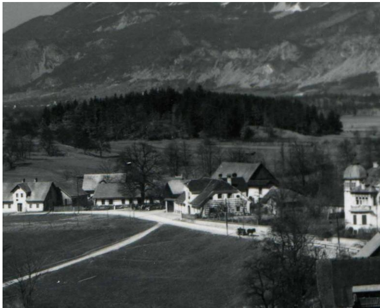
Stičišče glavne in lokalne ceste pred gostilno Hiršman, ok. 1935

Od Sokolskega doma je šla cesta nato po današnji trasi naprej v Lesce. Druga povezava s Kropo pa verjetno ob obzidju grajskega parka (takrat je bila meja obzidja na mestu, kjer je danes hotel Grajski dvor), mimo gostilne Kosmač, skozi stari del mesta, preko železniškega mostu proti Kropi.