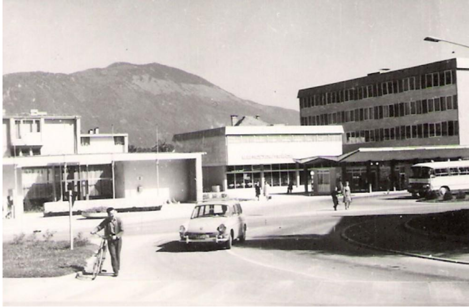
Izvoz z Avtobusne postaje v Radovljici, pred 1970