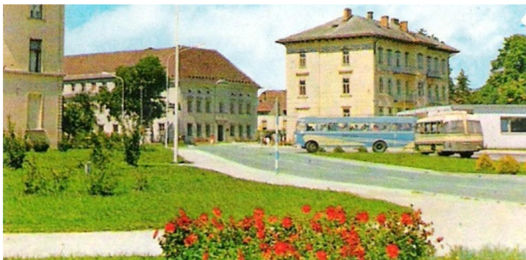
Izvoz z Avtobusne postaje, ok. 1965