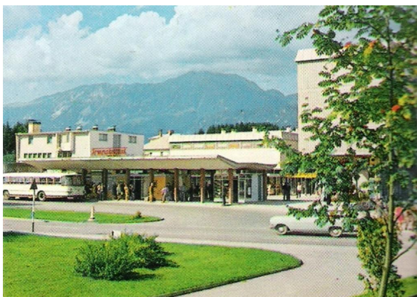
Avtobusna postaja Radovljica

Radovljiška avtobusna postaja v osemdesetih