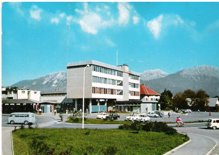
Parkirišče in Avtobusna postaja v Radovljici