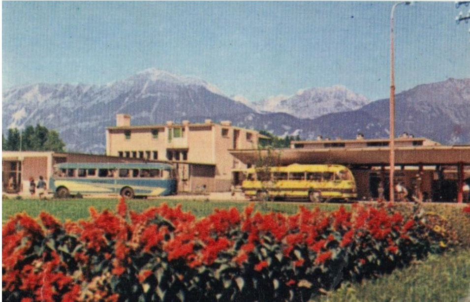
Avtobusna postaja Radovljica, ok. 1965