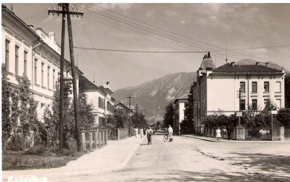
Križišče za hotelom Grajski dvor in hranilnico, od. 1934