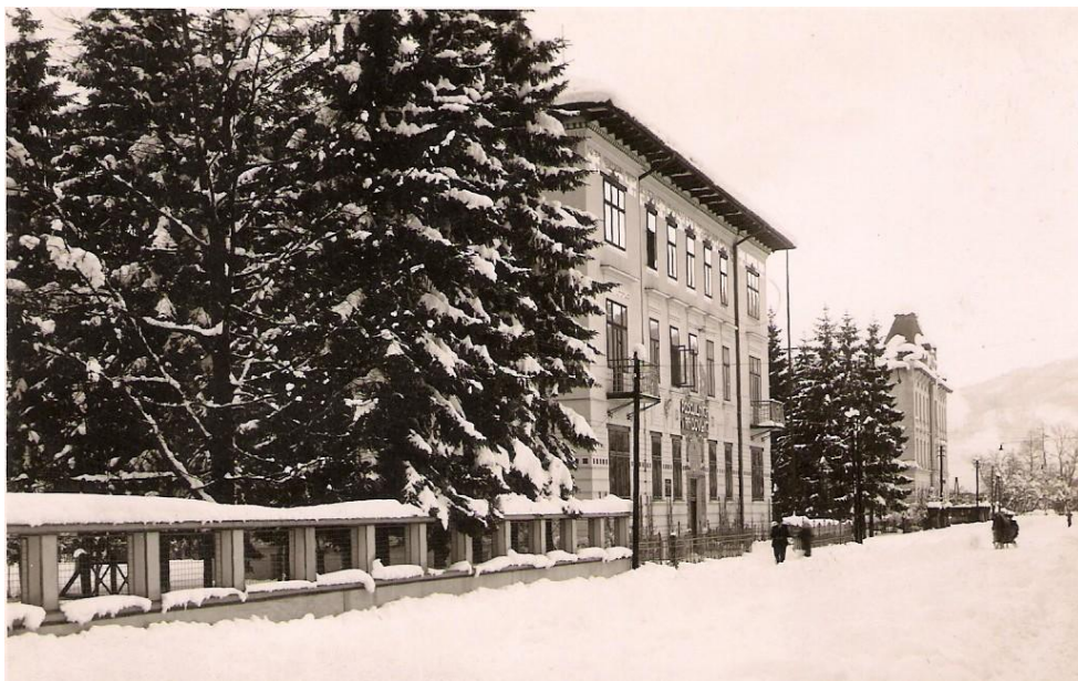
Cesta proti Lescam (mimo Posojilnice), ok. 1940