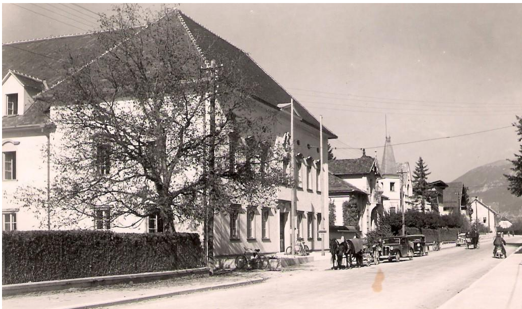
Cesta proti Lescam (mimo občine), ok. 1943

Pred vojno so bili v Radovljici le 3 avtomobili. Enega je imal urar Ambrožič, drugega pek Perc, tretjega pa dr. Slivnik. Pred tem (pred letom 1938) je imel avto v Radovljici dr. Voves. Četrty avto je imel v lasti tudi geometer, ki pa se z njim ni nikoli vozil. Petega so imeli še gasilci.