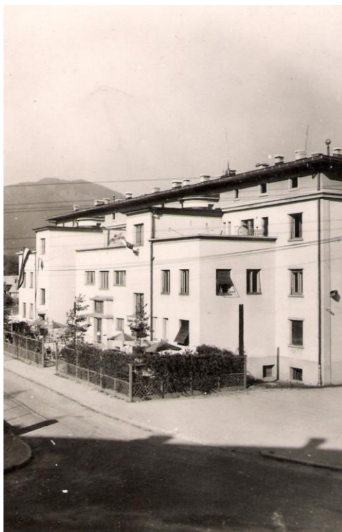
Cesta ob hotelu Grajski dvor, ok. 1940