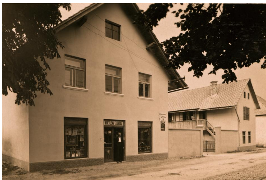
Cesta mimo Zadruge, ok. 1940