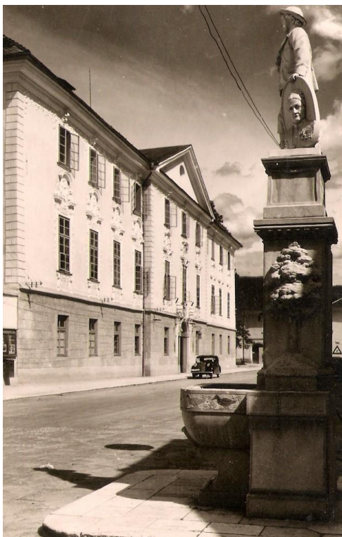
Cesta mimo Graščine, 1943