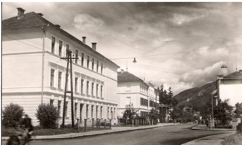
Priključek za Kropo pri hotelu Grajski dvor, ok. 1950