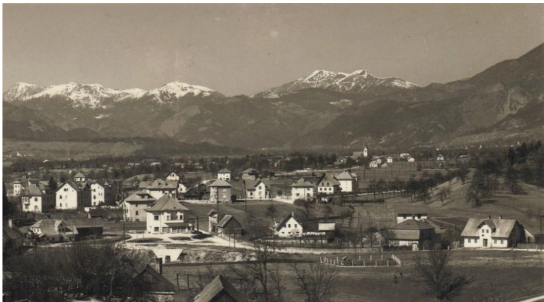
Cesta od Rodarja do Makaca, ok. 1935