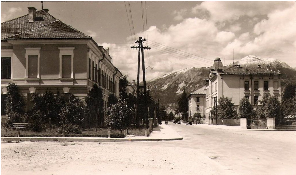
Cesta proti Lescam, ok. 1940