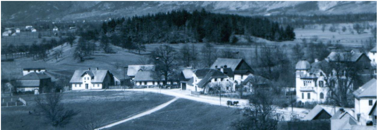
Cesta mimo gostilne Hiršman, ok. 1935