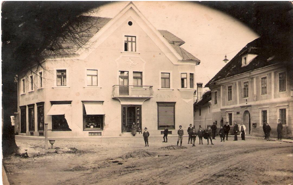
Cesta mimo Savnika, ok. 1935