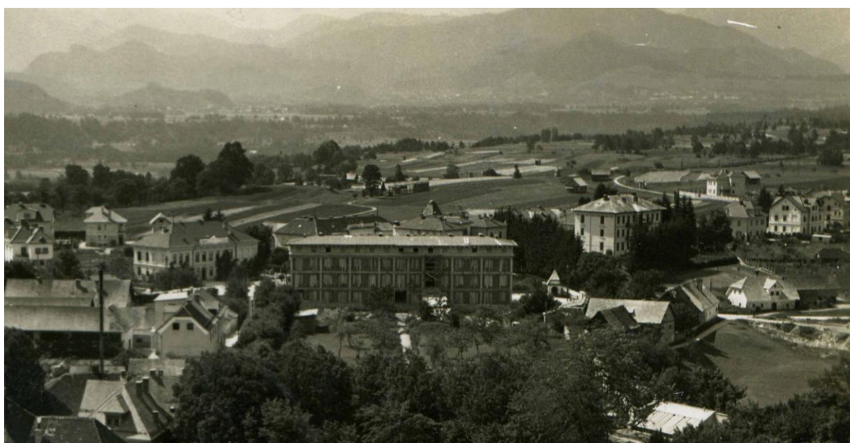
Cesta za hotelom Grajski dvor (od Makaca do Narodne šole), 1932 Vir: Digitalni arhiv Radovljica (detajl)