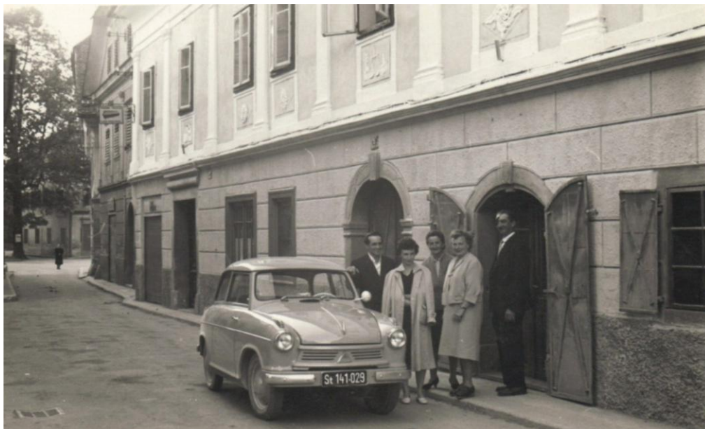
Cesta mimo Mencingerja, ok. 1950