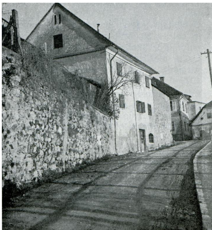
Cesta mimo Burcelja in Bezulneka, ok. 1950