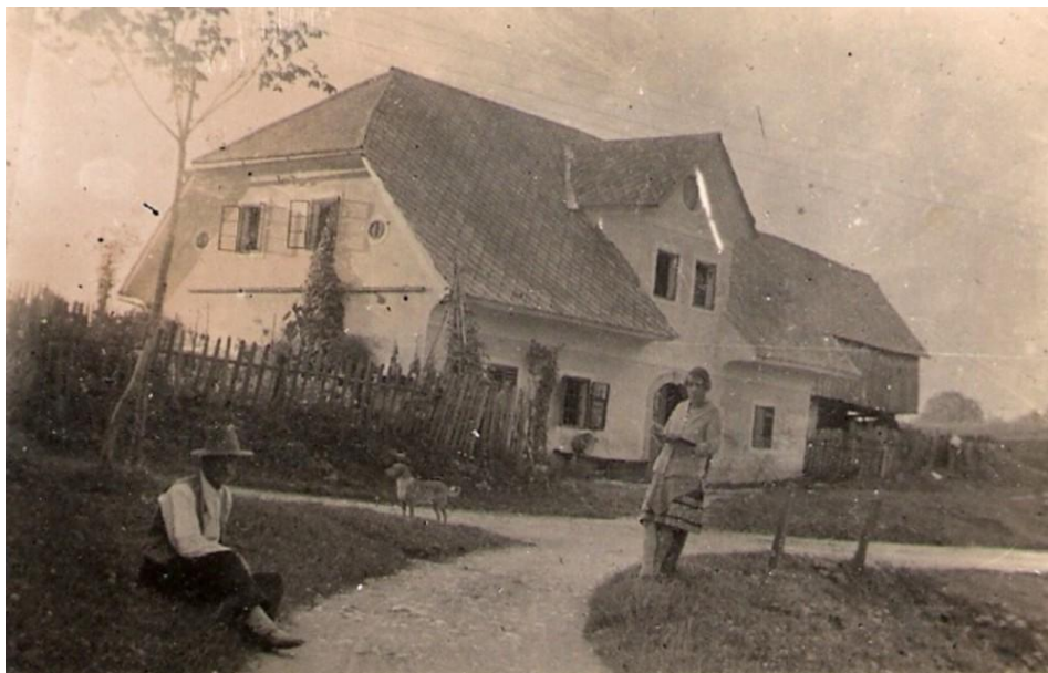
Cesta mimo Makaca, ok. 1935