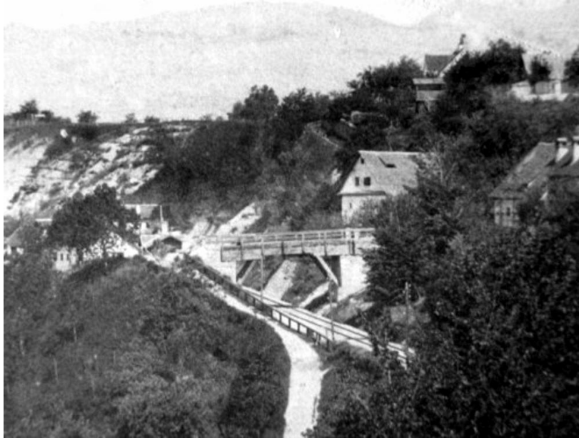
Urejanje postajališča v Radovljici, ok. 1890