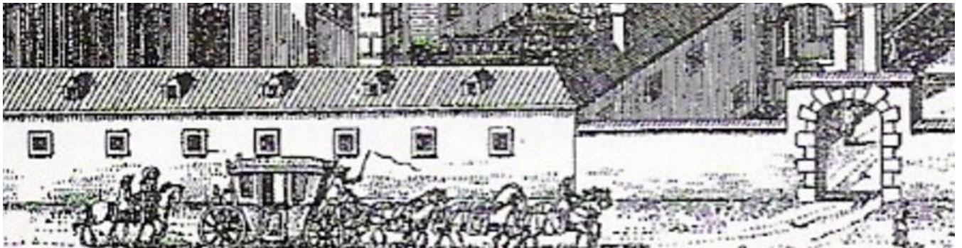
Šest-vprežna kočija pred gradom Kazenstein v Begunjah, 1679