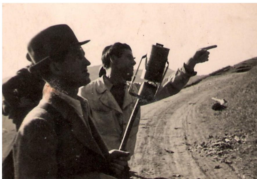
Cesta na Jamnik