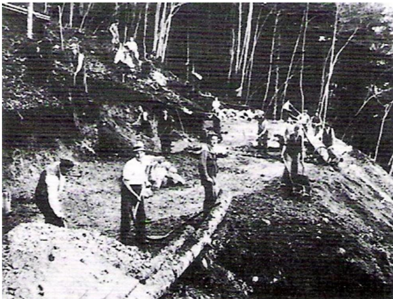
Gradnja ceste na Jamnik, 1940