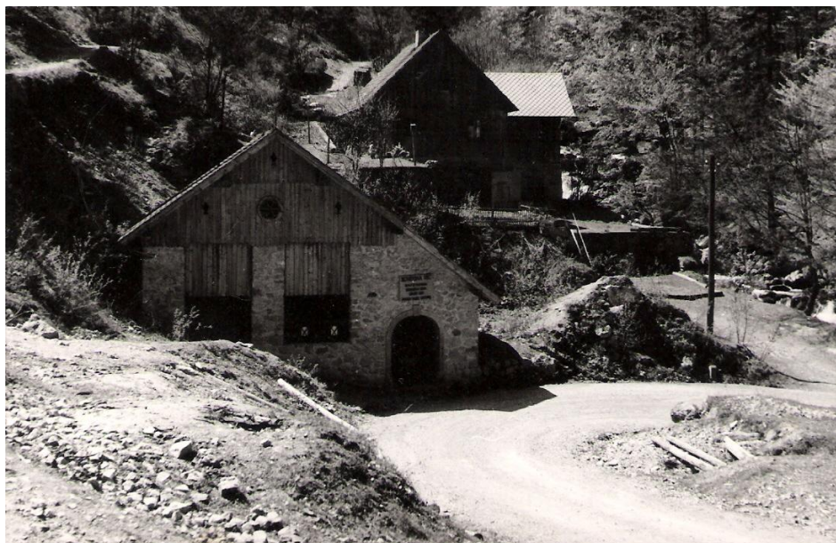
Cesta na Jamnik (mimo Slovenske peči), ok. 1960