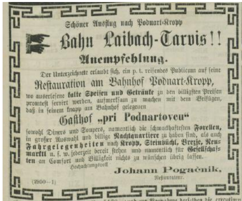
Oglas restavracije na postaji Podnart-Kropa, 1870