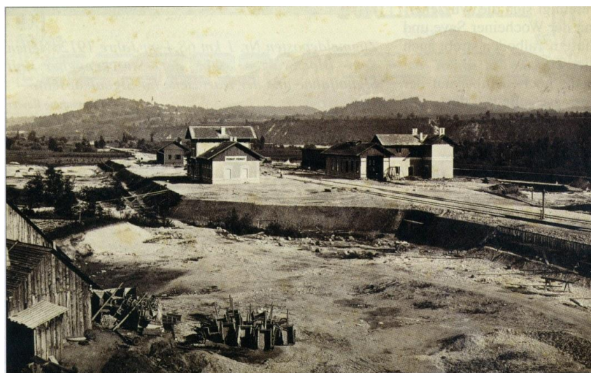
Bahnhof Podnart um 1870. Von hier mussten die Züge nach Assling nachgeschoben werden, darum der Bau eines Heizhauses. 1877 die Kranjska Eisenbahn.