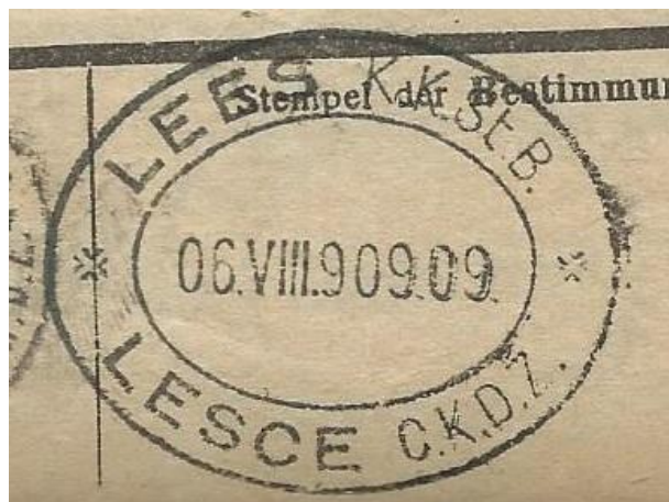
Žig c. kr. državne železnice – postaja Lesce, 1909