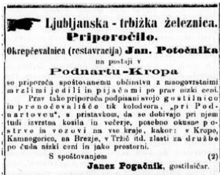
Oglas Okrepčevalnice na postaji Podnart-Kropa, 1870