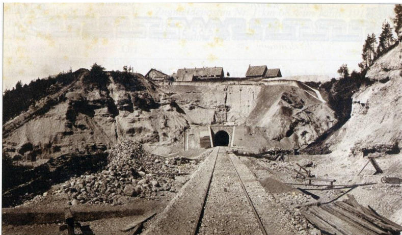
Große Erdbewegungen waren beim Bau des Radmannsdorfertunnel notwendig. Situation 1870.

Gradnja proge pri Globokem, 1870