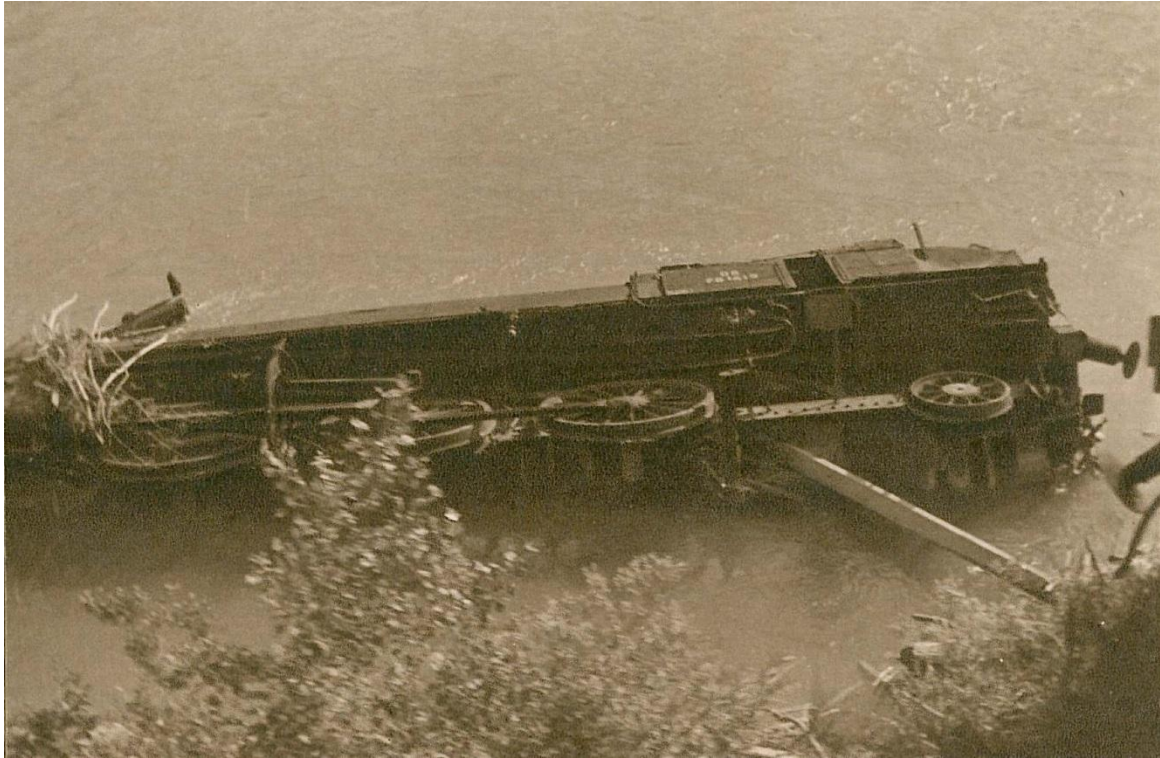
Lokomotiva v Savi pri Podnartu, 1942-45 Vir: DAR (knjiga Gorenjska)

Postaja v Podnartu. V kratkem bodo začeli na železniški postaji v Podnartu delati nove in moderne kretniške ter signalne naprave. S položitvijo kabla bodo vse te naprave elektrificirane in bodo tako do skrajnih možnosti preprečene nesreče. Naprave bodo tudi precej olajšale delo prometnikom in kretničarjem in zmanjšale težo odgovornosti pri dohodu in odhodu vlakov. Elektrifikacija signalnih in kretniških naprav je nedvomno velika pridobitev Podnarta, saj kaj podobnega še ni nikjer na gorenjski železniški progi.