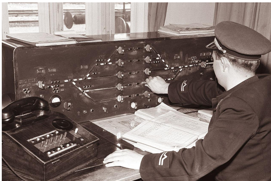
Kretniški pult v Podnartu, 1961