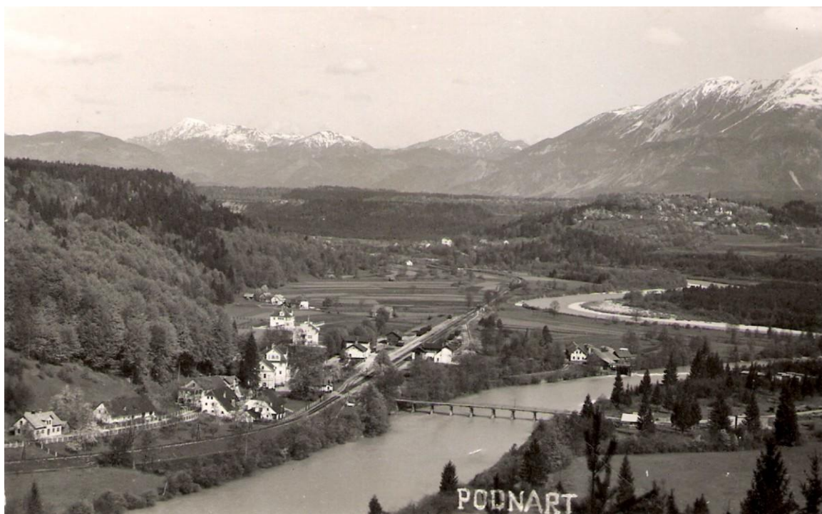
Podnart z železniško postajo, od. 1937