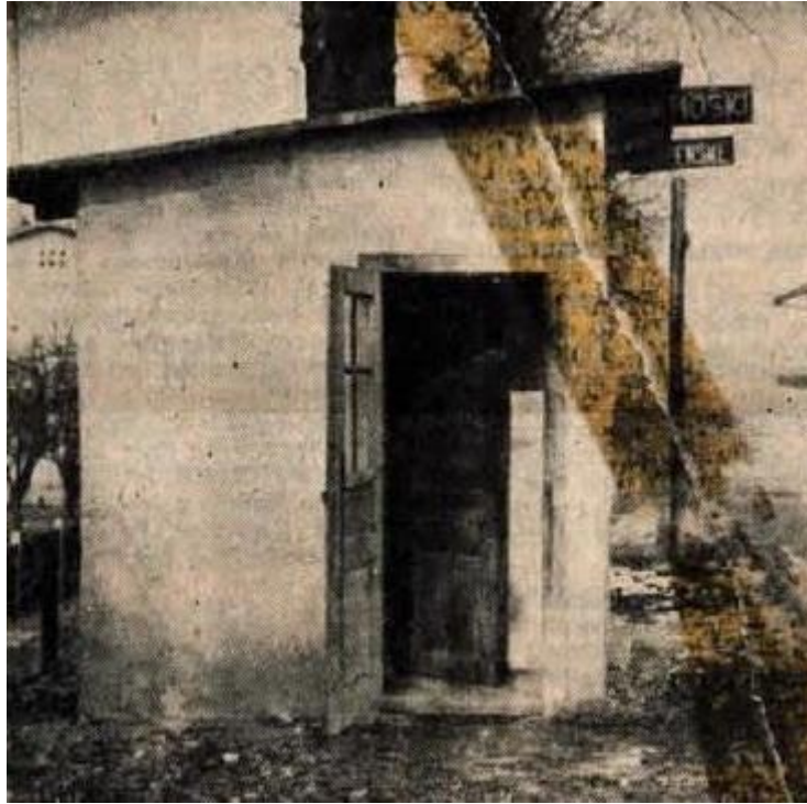
Stranišče na ŽP Podnart