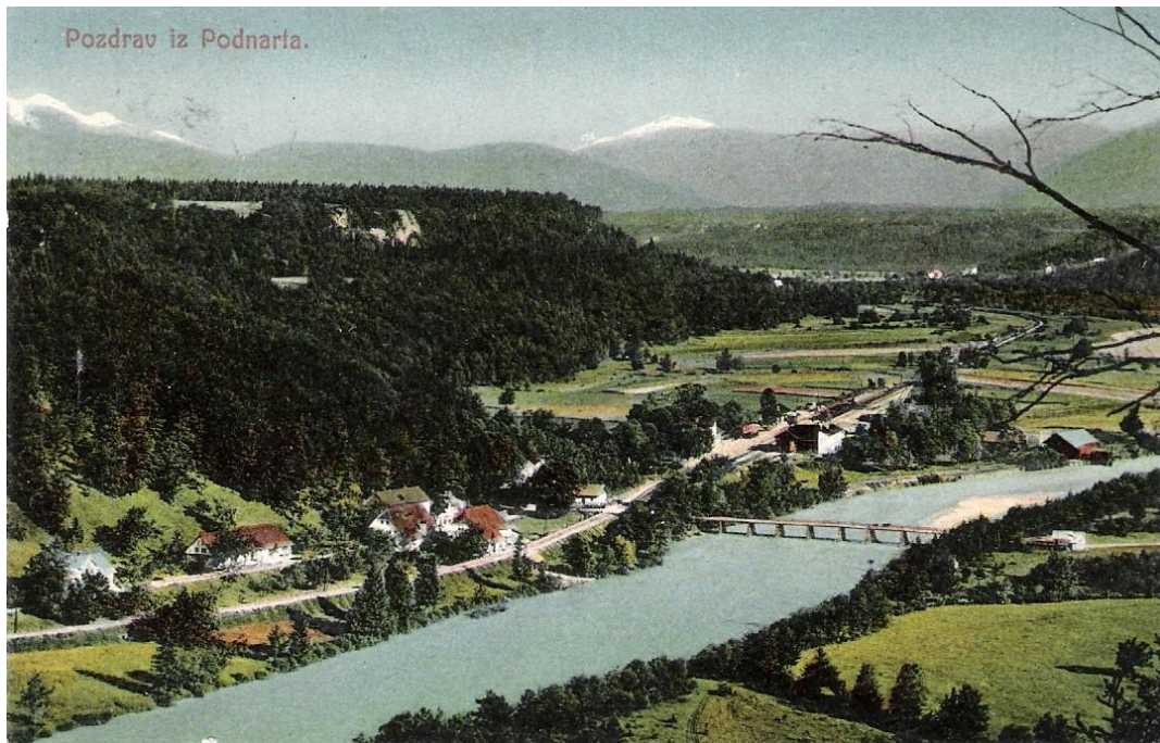
Podnart z železniško postajo, od. 1913