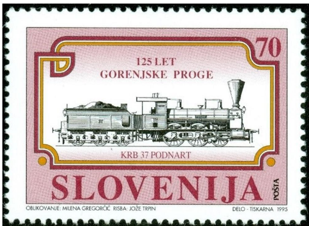
Lokomotiva »KRB 37 Podnart« na znamki, 1995