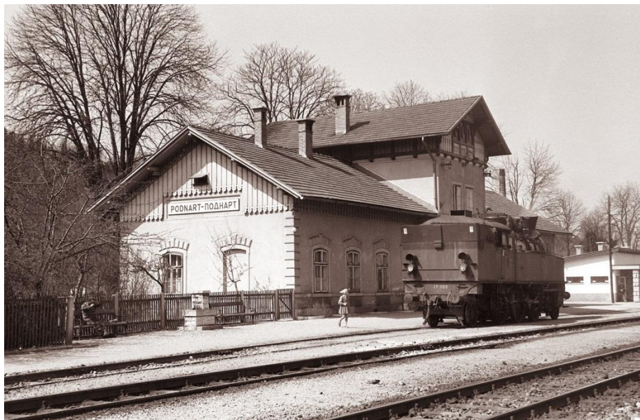
Železniška postaja Podnart, 1961