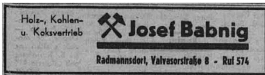
Oglas iz leta 1943