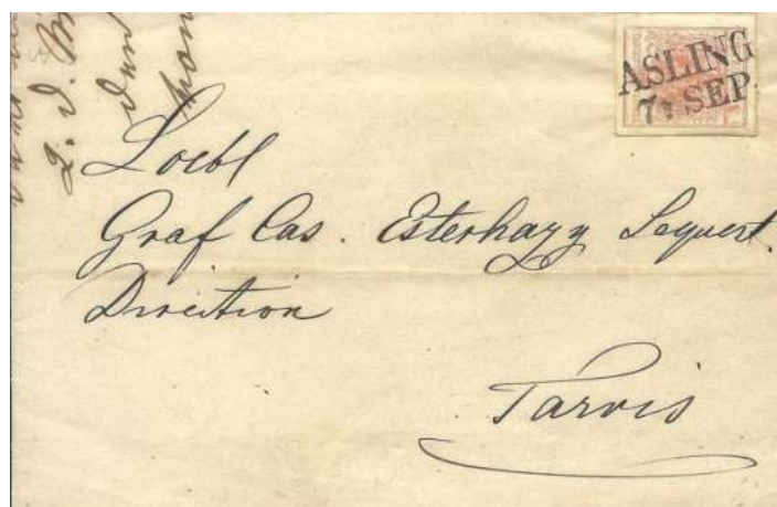
Poštni žig Asling (Jesenice), 1856