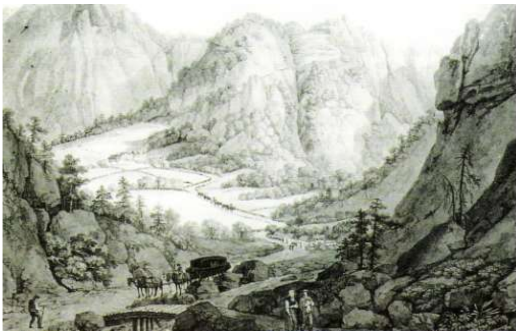
Poštna kočija na Ljubelju, ok. 1800 Vir: K. Postl in F. Runk