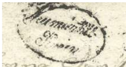
Poštni žig Tržič, 1833