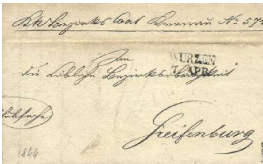
Poštni žig Wurzen (Podkoren), 1844