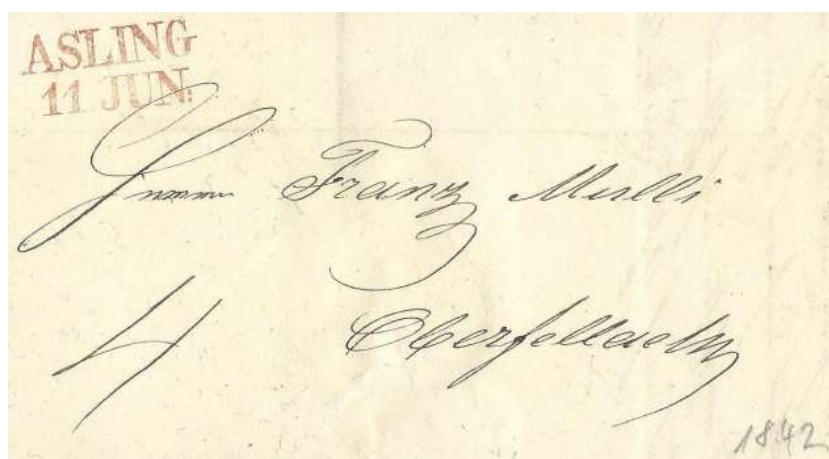
Poštni žig Asling (Jesenice), 1842