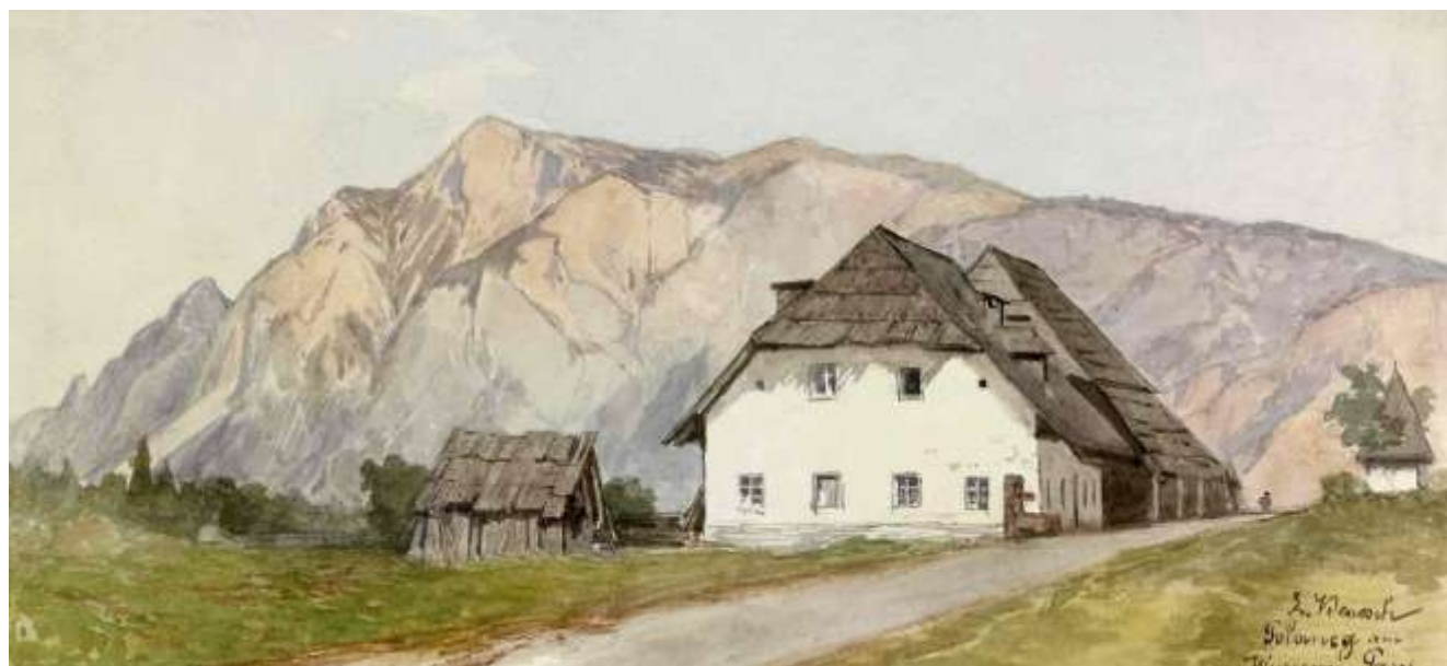
Gostilna na Korenskem sedlu, ok. 1890