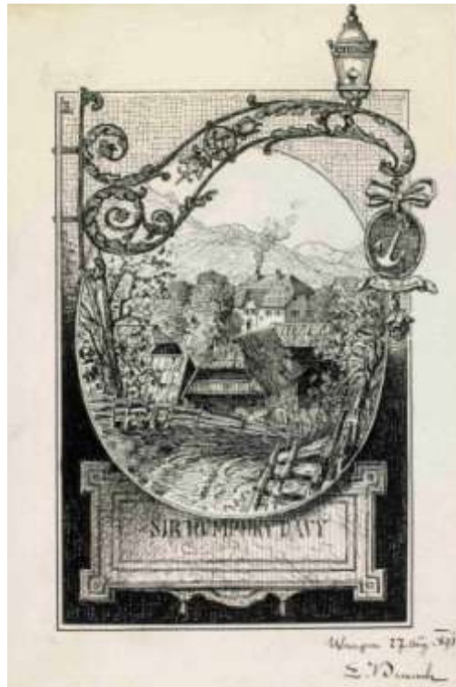
Poštna postaja »Pri Razingerju«, 1891 Vir: slikar Vladimir Benesch