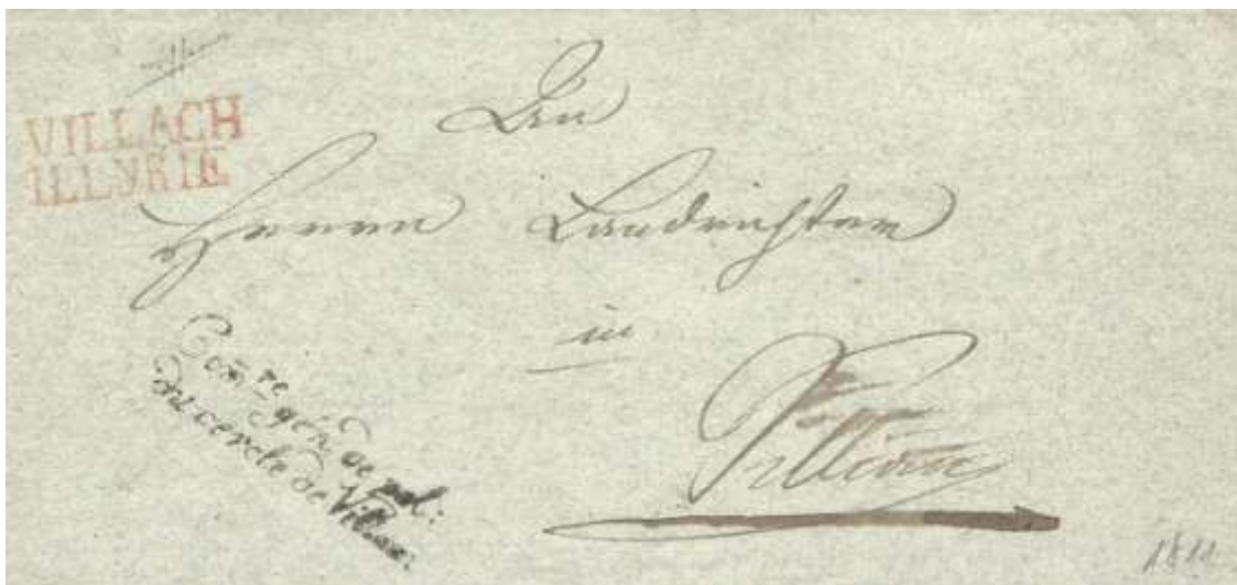
Poštni žig Villach (Beljak), 1811