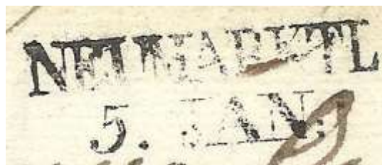
Poštni žig Tržič, 1838