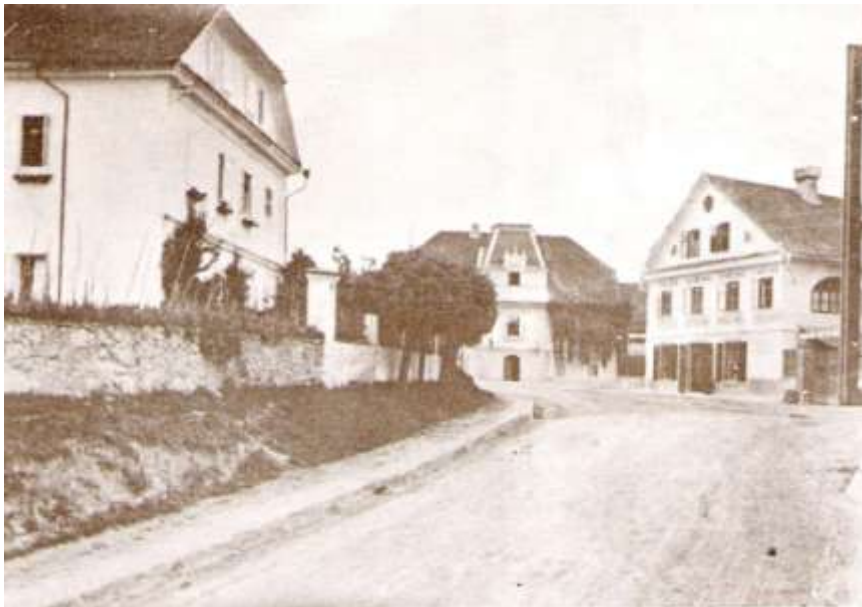
Poštna postaja Kranj – vrh Jelenovega klanca, ok. 1910 Vir: Gorenjski muzej Kranj (GKiL V.)