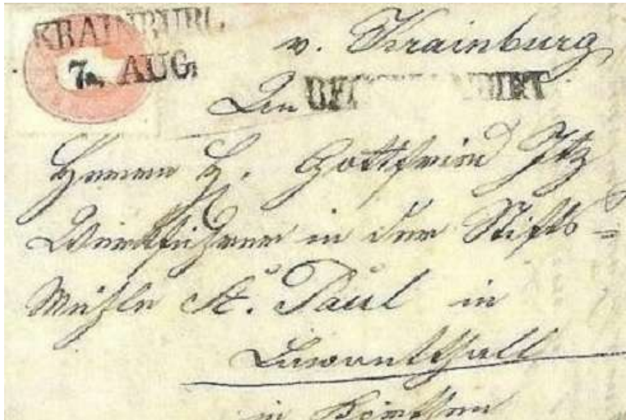
Poštni žig Krainburg (Kranj), 1860