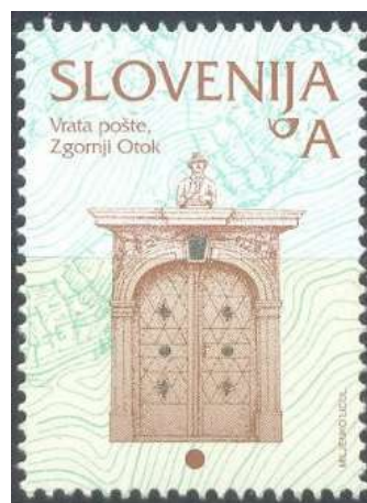
Portal in znamka portala poštno postaje na Zg. Otoku