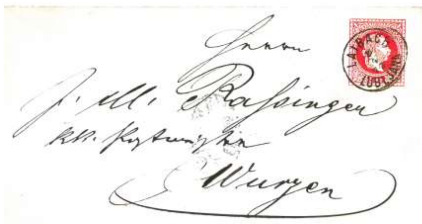
Pismo naslovljeno na c. kr. poštarja Razingerja, 1873