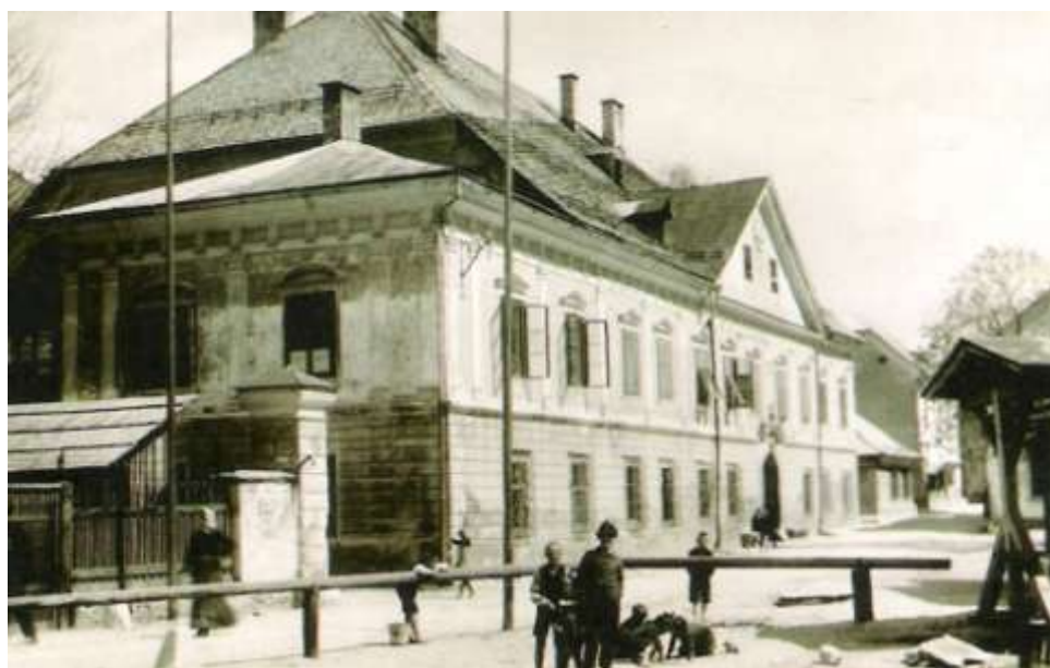
Cesta mimo Ruardove graščine na Stari Savi