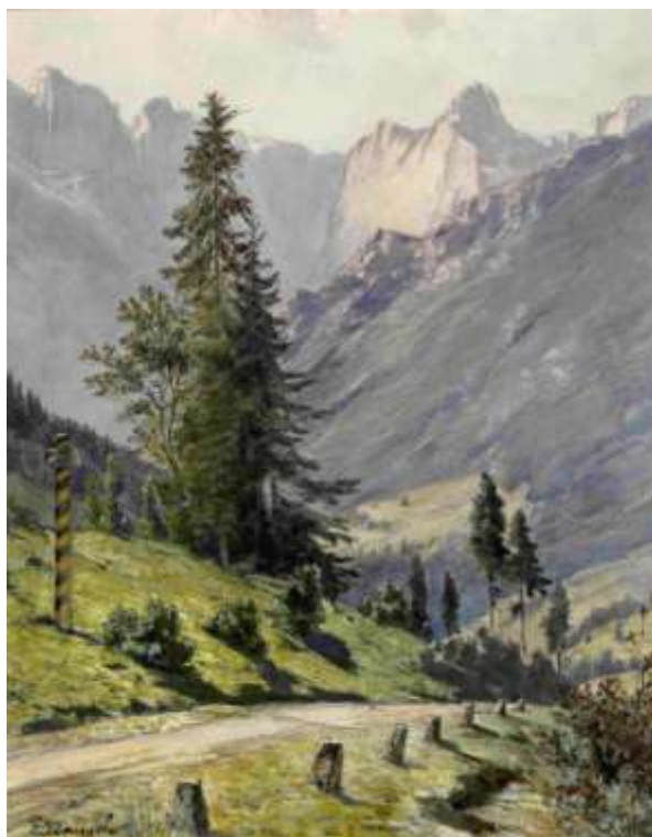
Cesta na prelaz Koren, 1891