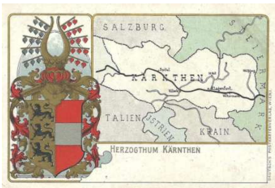
Razglednica Koroške, ok. 1900