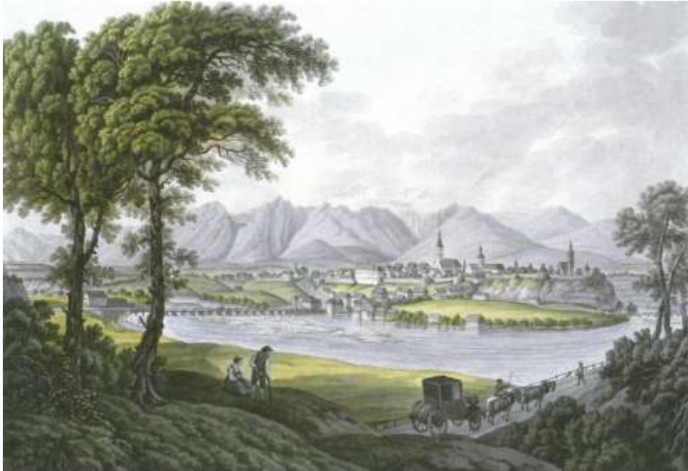
Poštna kočija pred Kranjem, ok. 1800 Vir: Ferdinand Runk in J. Ziegler