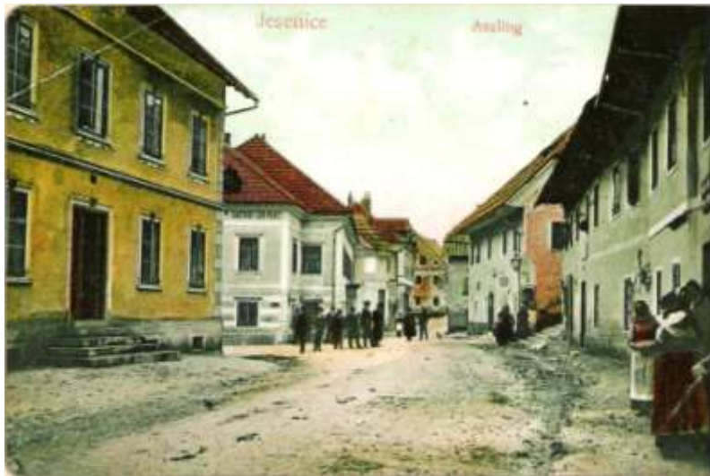
Stara pošta na Jesenicah, ok. 1900