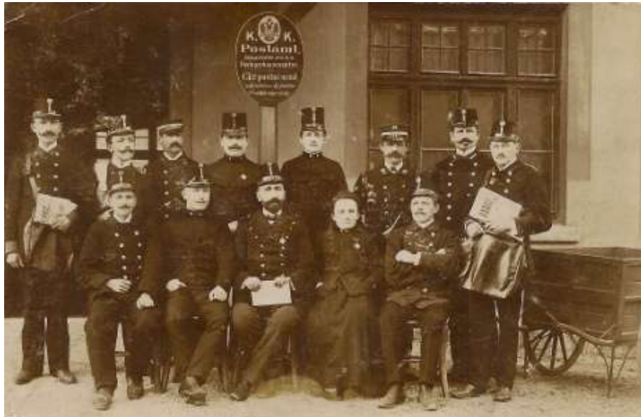
C. kr. poštni urad na kolodvoru Jesenice, 1910