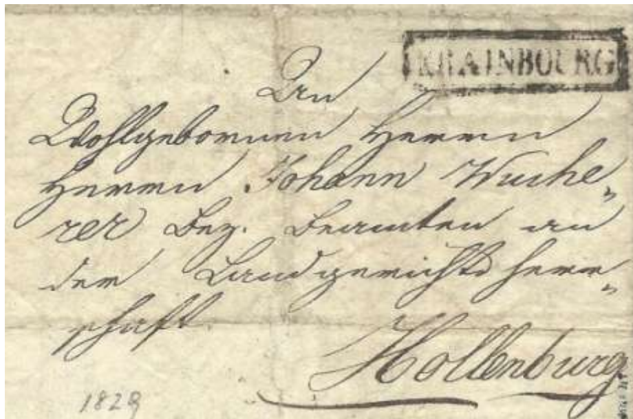
Poštni žig Krainbourg (Kranj), 1829