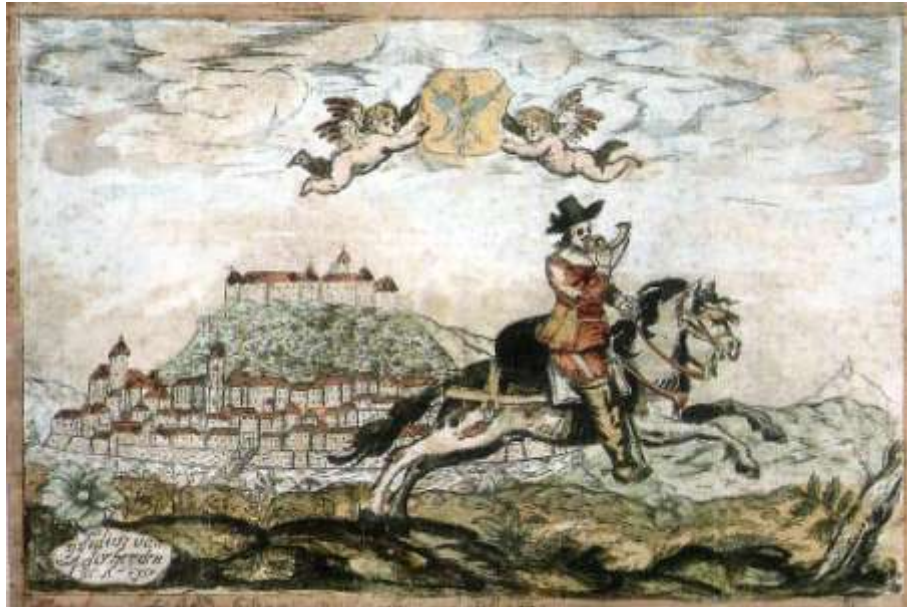
Postiljon pri odhodu iz Ljubljane, 1680