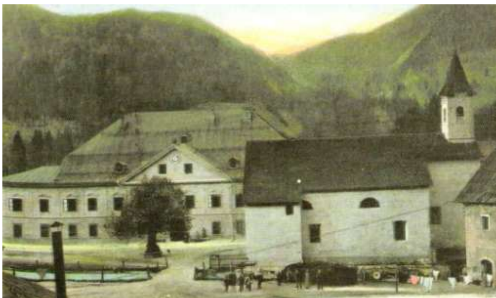
Ruardova graščina na Stari Savi, ok. 1900