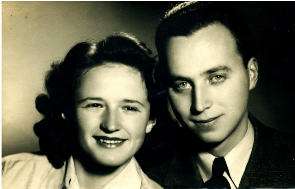
Zakonca Savnik

Nova hiša je bila zgrajena po letu 1922, na mestu bivše Murnikove hiše.