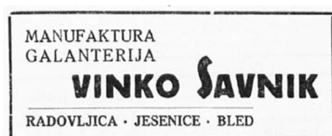
Oglas Vinko Savnik / Slovenčev koledar, 1941