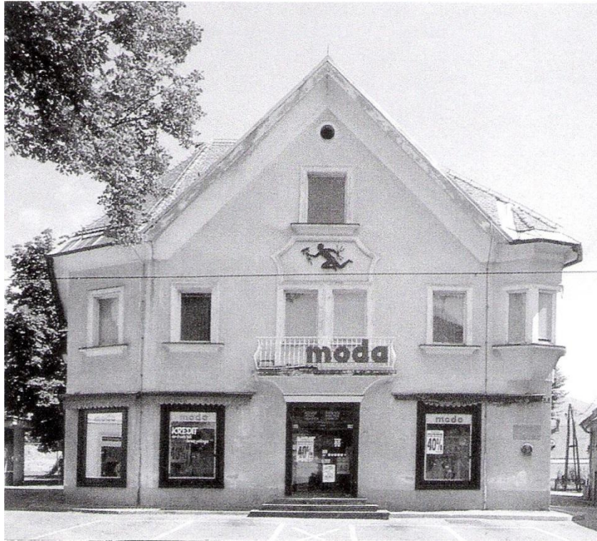
Trgovina Moda / Knjiga »Ivan Vurnik«, ok. 1975