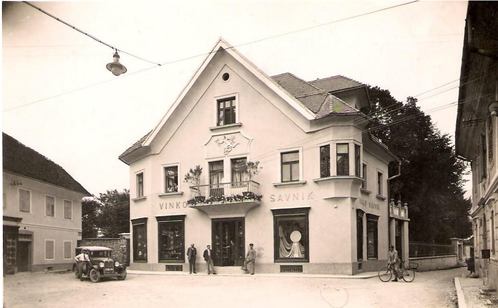
Vino Savnik ob svojem avtomobili in pred svojo trgovino / DAR, ok. 1930