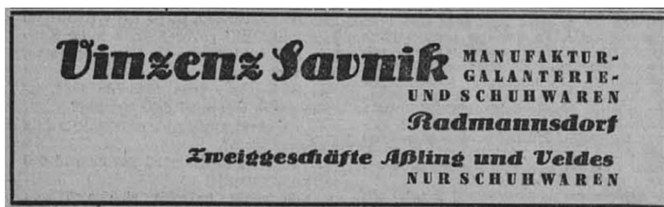
Oglas Vinko Savnik / Karawanken Bote, 1943