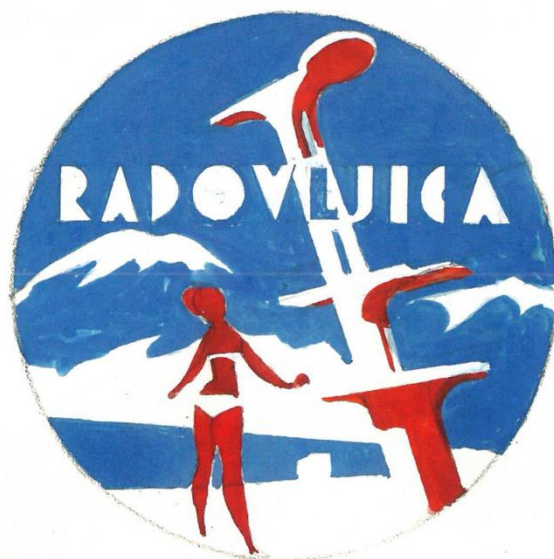
Eden izmed mnogih osnutkov Boltarja za potrebe TD Radovljica

Op.: Celovita zbirka vseh Boltarjevih predlogov za potrebe TD Radovljica, je objavljenih v Stari Radovljici (Podobe letoviške Radovljice, avtorica Nadja Jere) .