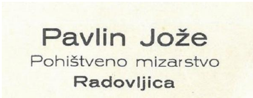
Poslovna vizitka Jožeta Pavlina, 1935