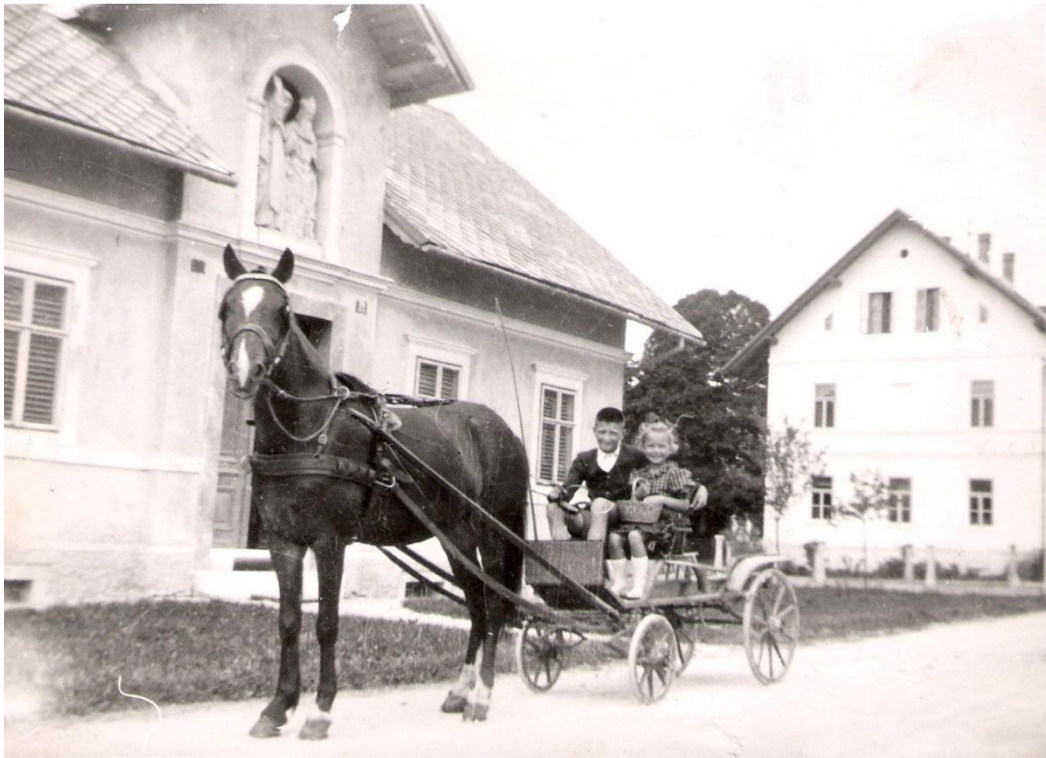
Pred Pavlinovo hišo, ok. 1950