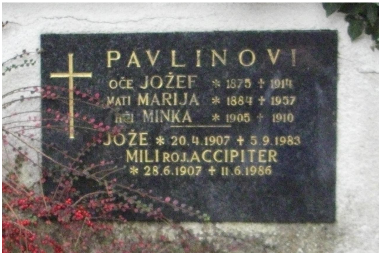
Nagrobna plošča na pokopališču v Radovljici