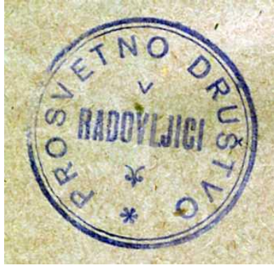
Žig »Prosvetno društvo v Radovljici«

Redna letna skupščina svobod in prosvetnih društev Gorenjske. Odlikovanja Zveze svobod: ... pohvalne diplome za uspešno kulturno-prosvetno delo so prejeli: ... Svoboda Lesce, Prosvetno društvo Radovljica, Prosvetno društvo Mošnje, Svoboda Podnart, Prosvetno društvo Kropa. / Op.: Omenjeno tudi Kulturno umetniško društvo Radovljica. Vir: Ljudska pravica, 31. 1. 1956