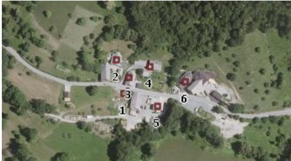
Srednja vas – orto-foto posnetek, 2016