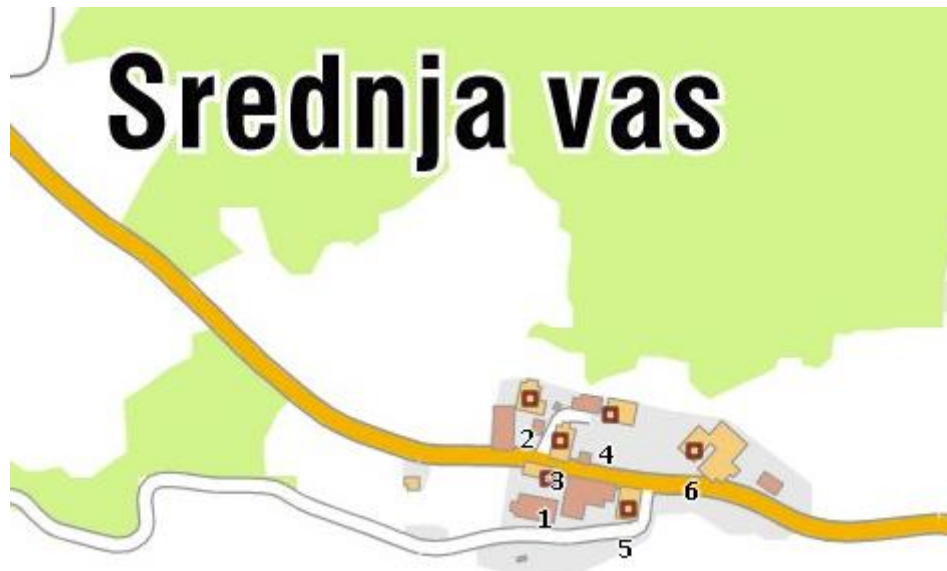
Srednja vas – topografska karta, 2016