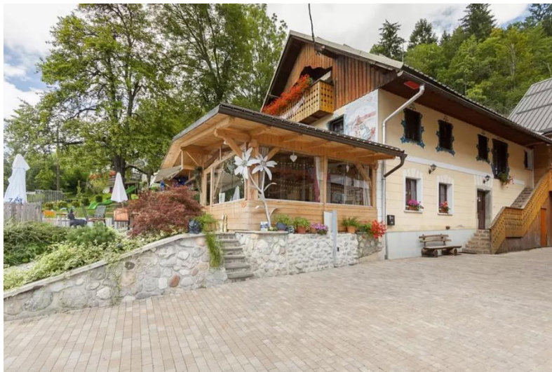
Pri Trlejšu Vir: www.trlejš.com