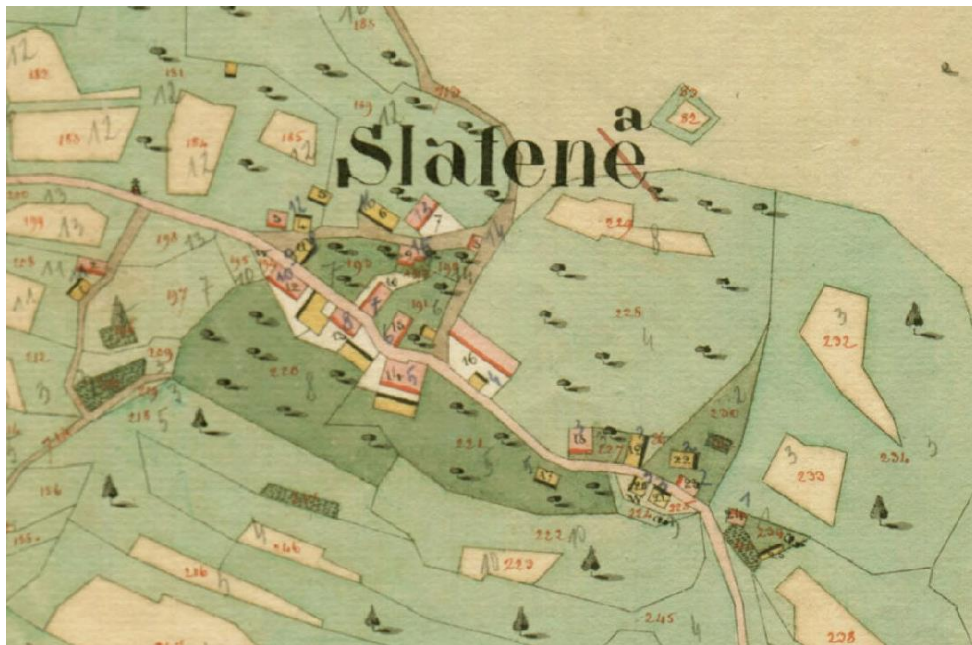
Slatna na karti franc. katastra, 1827