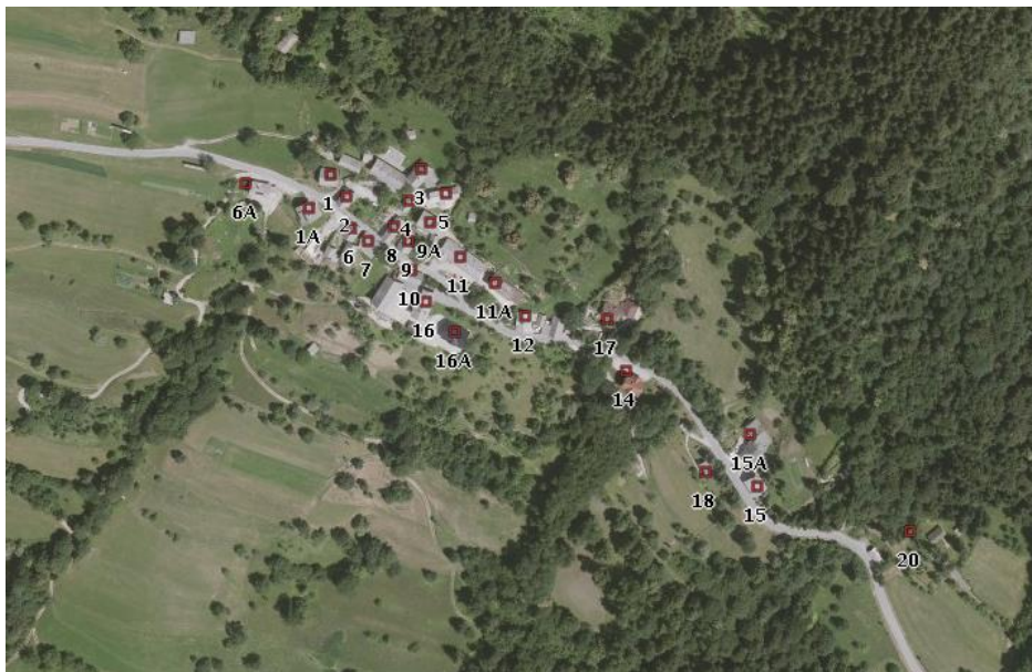
Črnivec – orto-foto posnetek, 2016