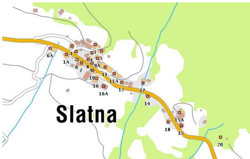
Slatna – topografska karta, 2016