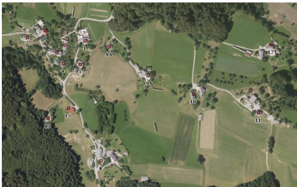
Rovte na orto-foto posnetku, 2013