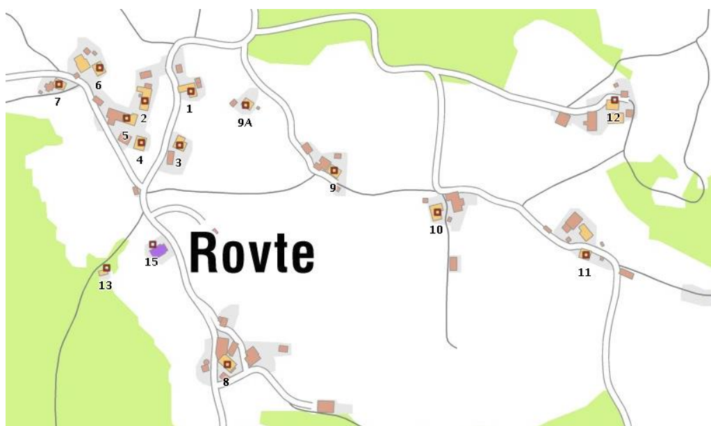
Rovte na topografski karti, 2013