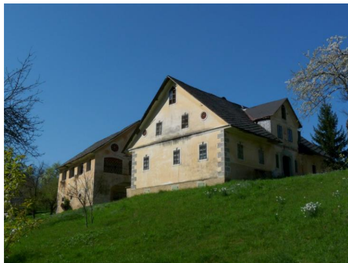
Pri Prekuhu, 2015