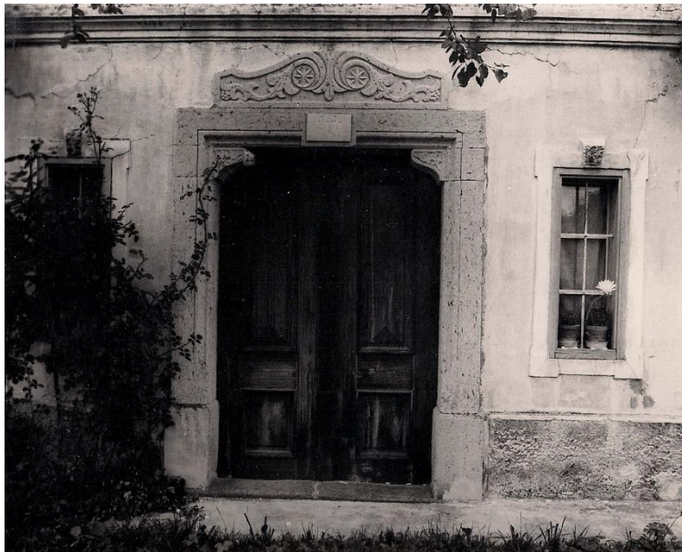
Pri Prekuhu

Rovte št. 4 – Prekucha (lastnik Jeralla, FK 1827), Prekuh (lastnik Jerala, SA 1855), Prekuh (lastnik Jerala, SA 1894). // Rovte št. 4 – Pri Prekuhu.