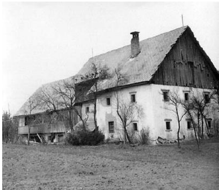
Pri Udanču, 1965

Prezrenje št. 6 – Odametz (lastnik Pogatschnig, FK 1827), Udamč (lastnik Ovsenik, SA 1890). // Prezrenje št. 12 – Pri Udanču .