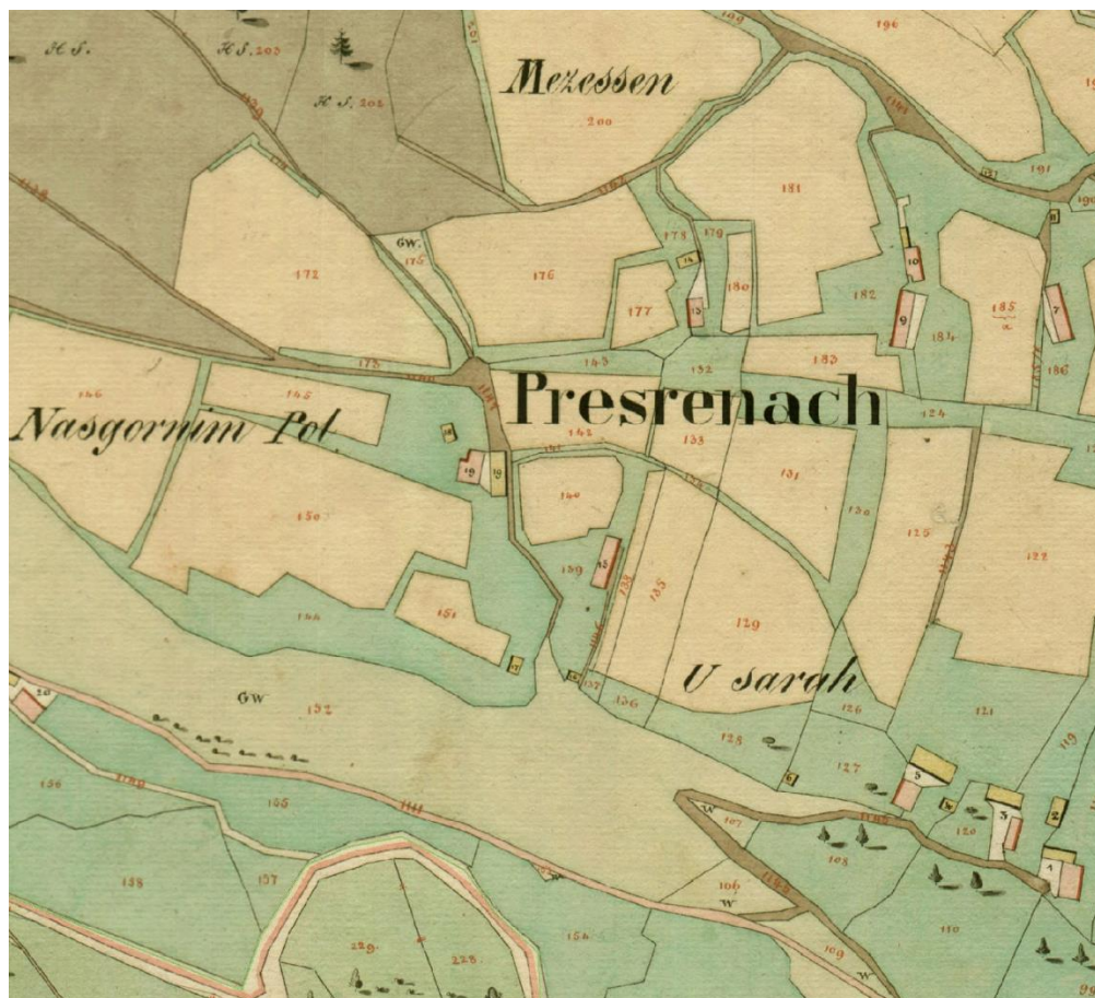
Prezrenje na karti franc. katastra, 1827