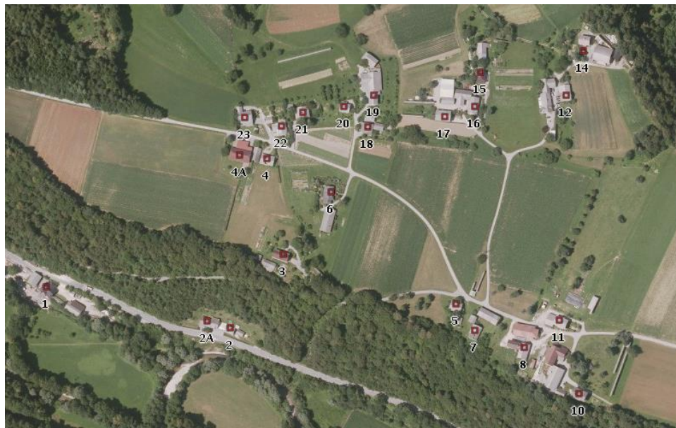
Prezrenje na orto-foto posnetku, 2013