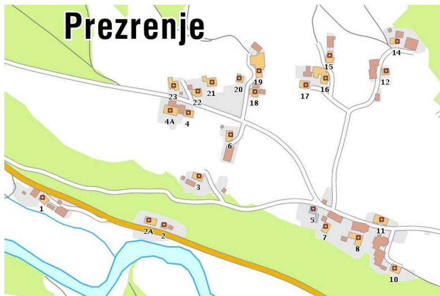
Prezrenje na topografski karti, 2013