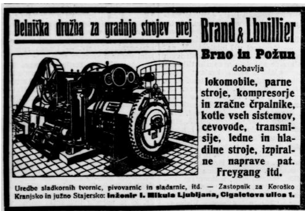
Oglas lokomobile, 1915 Gorenjec, 15. 01. 1915

1920. V srednjem mlinu so zgradili malo hidroelektrarno moči 10 KM (7.5 KW). Postavitev elektrarne je začetek intenzivne elektrifikacije tovarne med obema vojnama, ne glede na to, da so elektriko v majhnih količinah proizvajali že prej.