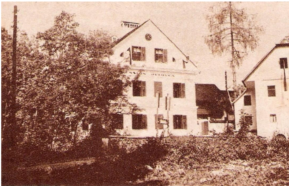
Leseni drog daljnovoda v Kamni Gorici, 1929