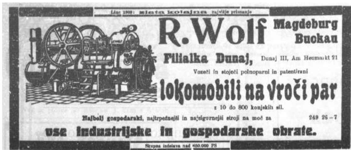
Oglas lokomobile, 1910 Gorenjec, 15. 01. 1910

Lokomobila, ok. 1920 Vir: Vigenjc IV. (Glasilo Kovaškega muzeja v Kropi, 2004).